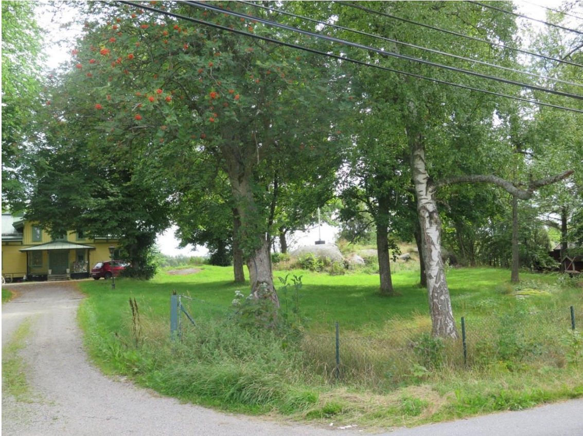
LP_2014_00190. Till vänster i bild den del av fastigheten som har avstyckats och bildar Korallrotten 17. Foto taget från Gamla Dalarövägen.