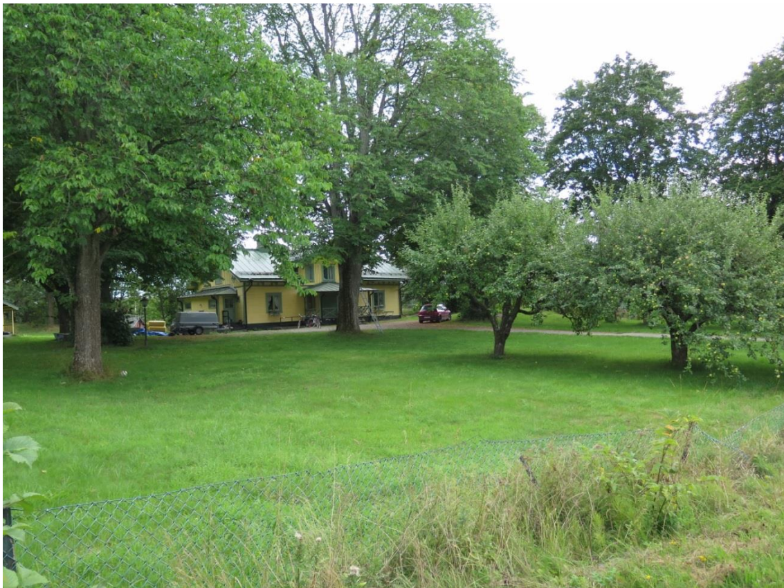
LP_2014_00187. Huvudbyggnaden på Korallroten 15, f d Länna gästgiveri. Foto taget från Gamla Dalarövägen.

Trädgården, med de gränser som fastigheten hade före avstyckningen, har sin största sträckning väster, norr och söder om byggnaden. Från Gamla Dalarövägen fram till huvudbyggnaden går en grusgång. I övrigt finns gräsmatta på marken. I trädgården finns fruktträd och ett flertal äldre ädellövträd. En lekstuga och en bod finns. Sydväst och söder om huvudbyggnaden finns en bergknalle där en flaggstång står. Trädgården omgärdas mot gatan av ett lågt Gunnebestängsel.