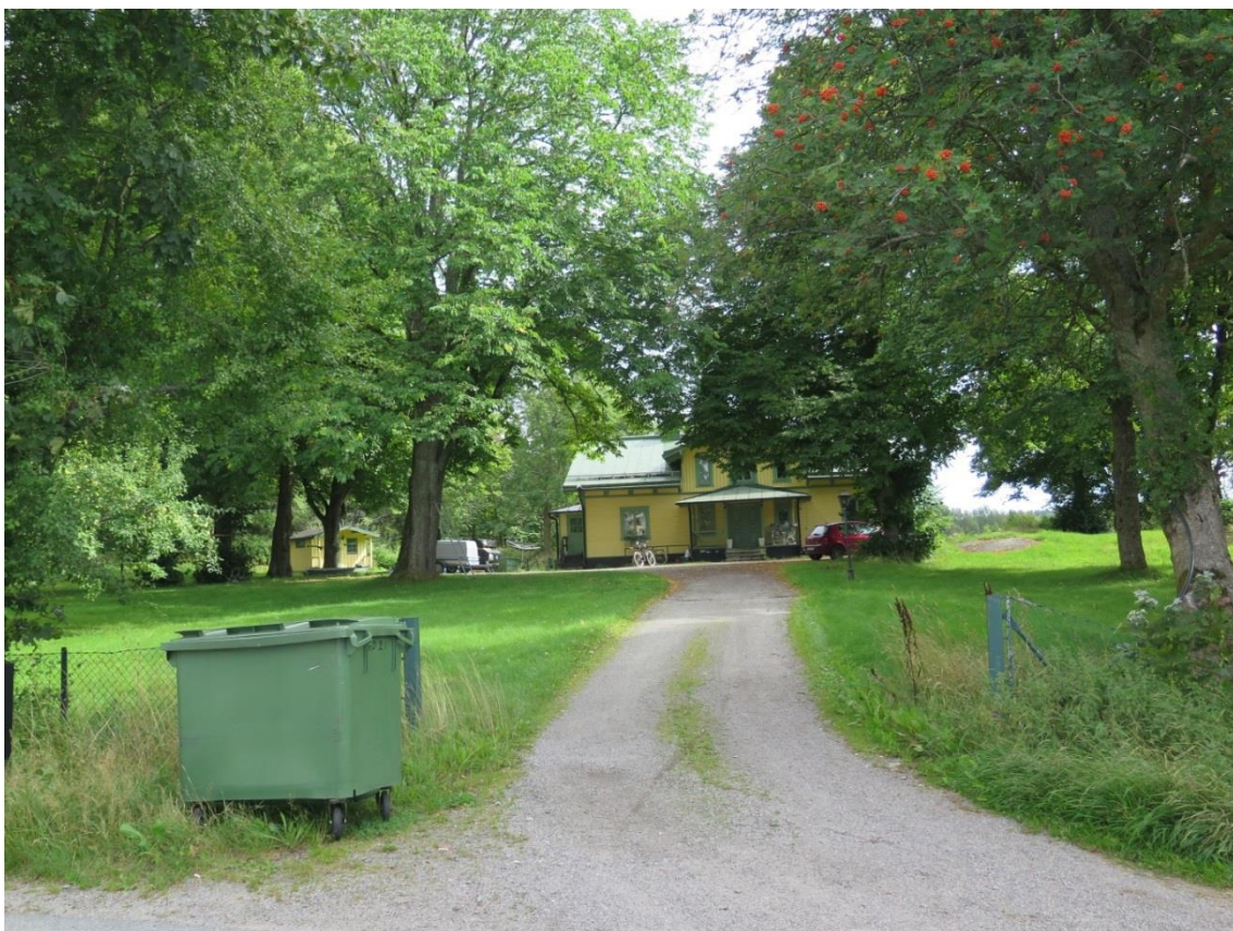
LP_2014_00188. Huvudbyggnaden på Korallroten 15. Foto taget från Gamla Dalarövägen.