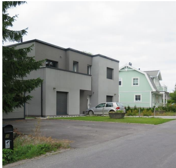
LP_2014_00192. Till höger nybyggda villor på andra sidan Gamla Dalarövägen.