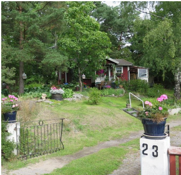
LP_2014_00191. Till vänster tomten som gränsar till Korallrotten 17, bebyggd med ett fritidshus.