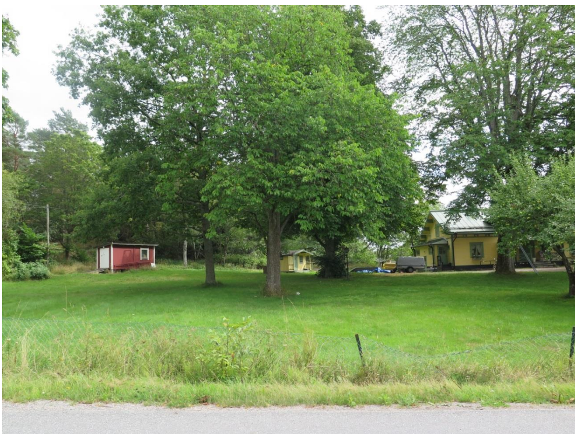
LP_2014_00189. Den del av fastigheten som har avstyckats och bildar Korallroten 16. Foto taget från Gamla Dalarövägen.