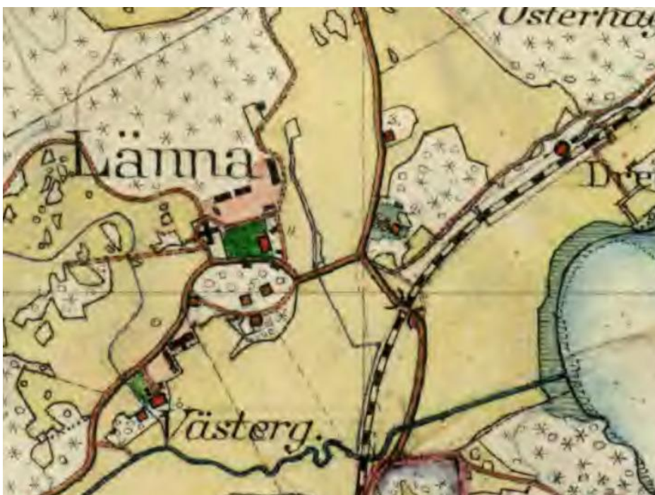
Utsnitt ur den hädsekonomiska kartan från 1901-06. Gästgiveriet, nuvarande Korallroten 15-17, ligger strax öster om Läna gård, mellan landsvägen och järnvägen.

1937 styckades mark av för att bebyggas med villor och sommarstugor. Gästgiveriet och byggnaderna på Läna gård är de enda äldre byggnader som återstår av det som var Läna by.