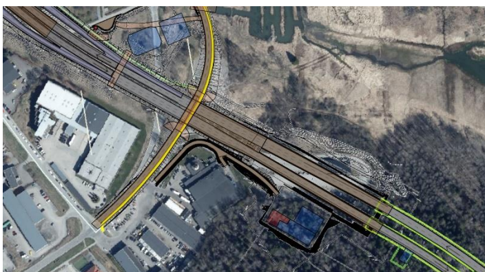
Figur 2: Illustration över Tvärförbindelse Södertörn vid planområdet.

Nuvarande detaljplaner inom planområdet reglerar natur, återvinningscentral och kvartersmark och dessa är i strid mot tvärförbindelsen. Detaljplanen syftar till att reglera Trafikverkets tekniska anläggning för bland annat VA samt möjliggöra en angoringsväg för användande av både Trafikverket samt verksamhet på