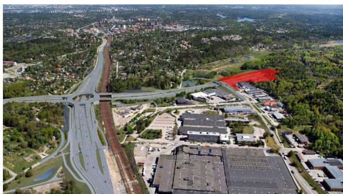
Figur 4: Vy mot trafikplats Vårdkasen. Röd transparent yta är ungefärligt planområde för detaljplanen.

I detaljplan för Solgård 1:1 m.fl. ansåg Kommunen att den inte antogs medföra betydande miljöpåverkan. Länsstyrelsen delade kommunens bedömning med beslut (Länsstyrelsens beteckning: 402-21706-2020).