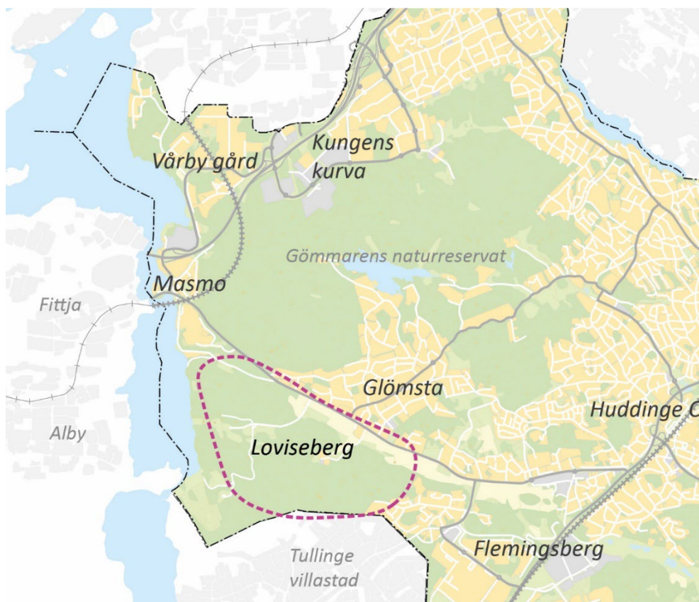
Figur 1: Ungefärligt programområde