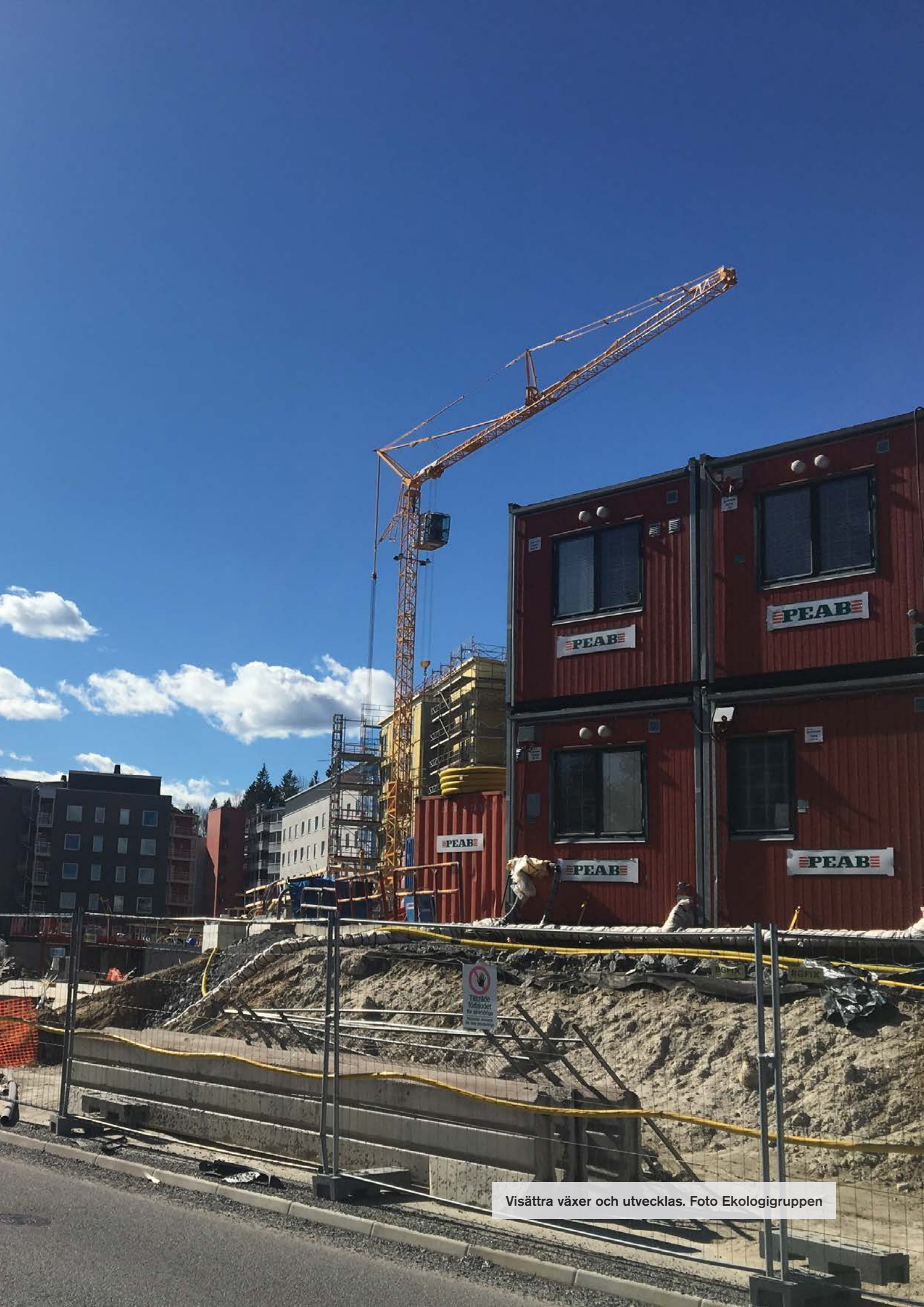
Visättra växer och utvecklas.