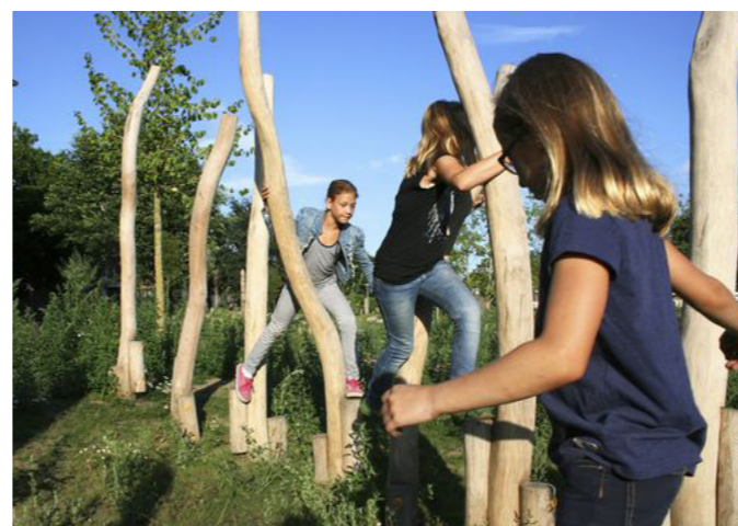
Lek integrerad i terräng