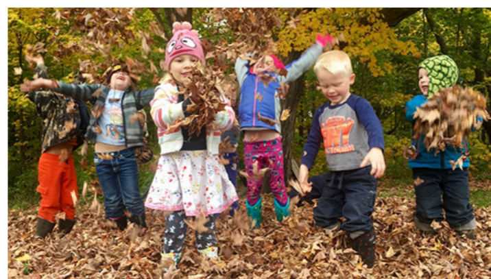
Löst material att leka med