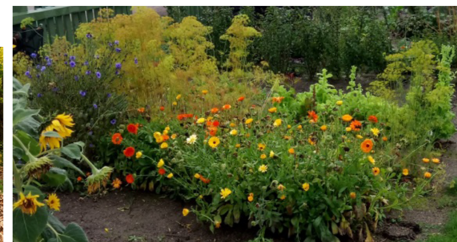
Odling och årstidsväxling