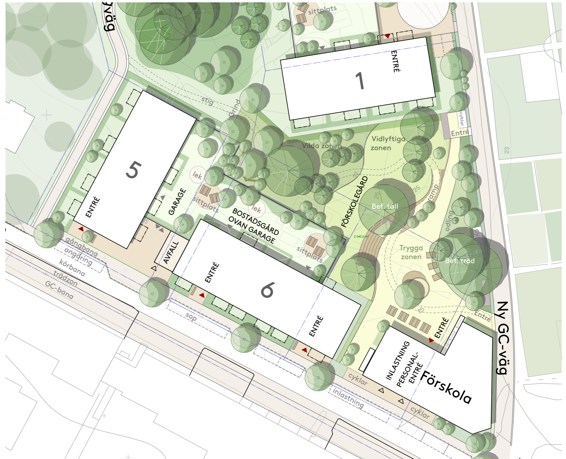
Illustrationsplan, skala 1:500/A3.