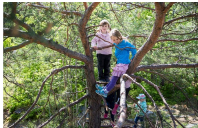
Befintlig vegetation att leka i