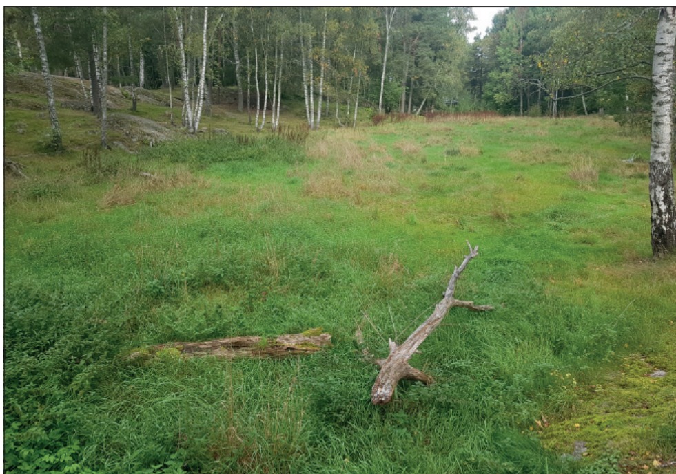
Figur 4. Objekt 2 från sydöst.

Direkt norr om Glömstaskolans skolgård påträffades en äng, den var 90 × 30 meter stor i nordväst–sydöstlig riktning och bevuxen med ängsväxter (figur 4). Den var det största plana ytan inom hela utredningsområdet och verkade vara stenröjd då sten påträffades i kanterna men inte på ängen. Ängen låg 15 meter söder om den möjliga stensättningen L2016:302 och var belägen i ett sadelläge mellan två lägre höjder med större partier berg i dagen.