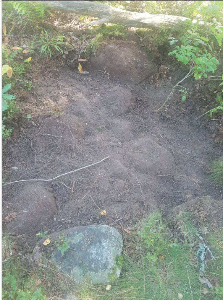
Figur 8. Den yta som rensades upp inom L2016:302, vilken utgick som fornlämning. Foto från söder.

En yta om cirka 2 m 2 rensades upp inom den förmodande stensättningen genom att busksly och torv avlägsnades. Det kunde konstateras att det rörde sig om en samling osorterade stenar med humös silt mellan dessa. Inget tydde på att det var frågan om en konstruktion. Stensättningen bedömdes vara en naturbildning och utgår därmed som fornlämning (figur 8).