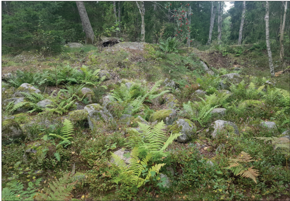
Figur 6. Stensättningen L2017:9789 från sydöst.

I samband med fältinventeringen besöktes stensättningen L2017:9789, som var belägen inom utredningsområdet (figur 6), dess beskrivning i KMR kunde bekräftas och kompletteras. Dess nuvarande lydelse är: