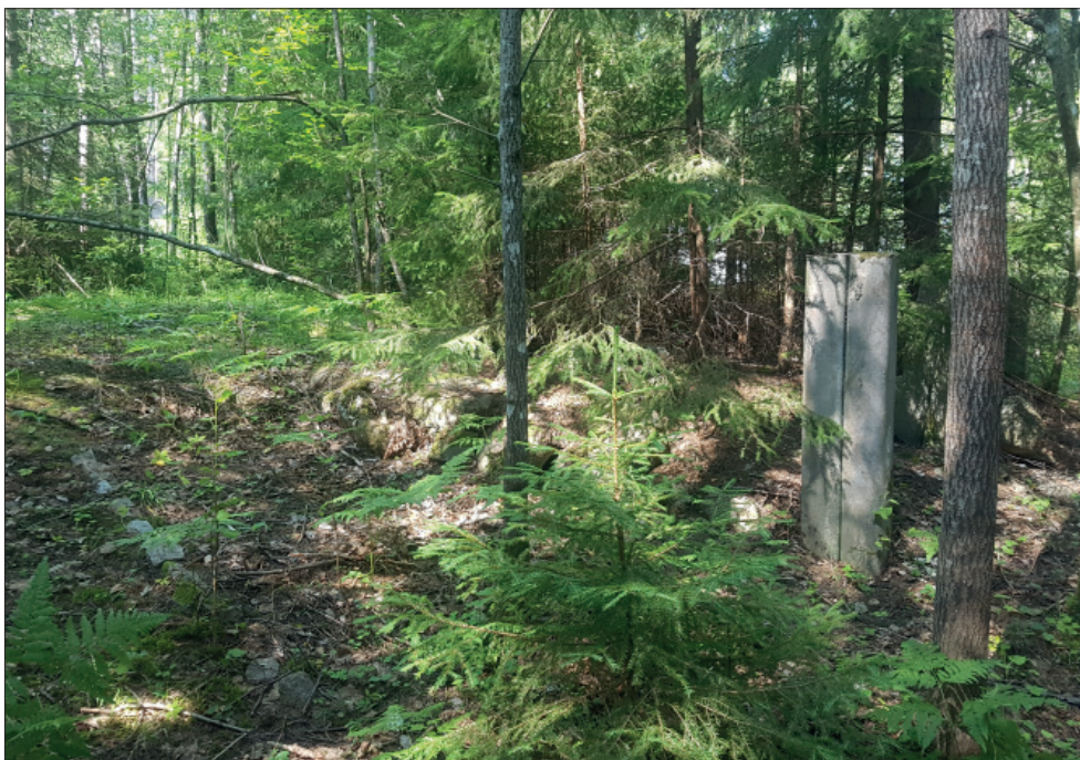
Figur 3. Betongplint, del av objekt 1, från söder.

I sydvästra delen av utredningsområdet påträffades lämningarna efter en sentida byggnad med enstaka trädgårdsanläggningar inom en befintlig småhusfastighet. Fyra gjutna betongplintar låg i en 5 meter lång rad i kanten av en terrassering som vetter mot nordöst (figur 3). Resterna av en stensyll kunde också skönjas i kanten av terrasseringen, den var 3 × 5 meter och bestod av stenar i storleken 0,3–0,4 meter. I närheten fanns rader av huggen gatsten som kan ha utgjort kanter av planteringar.