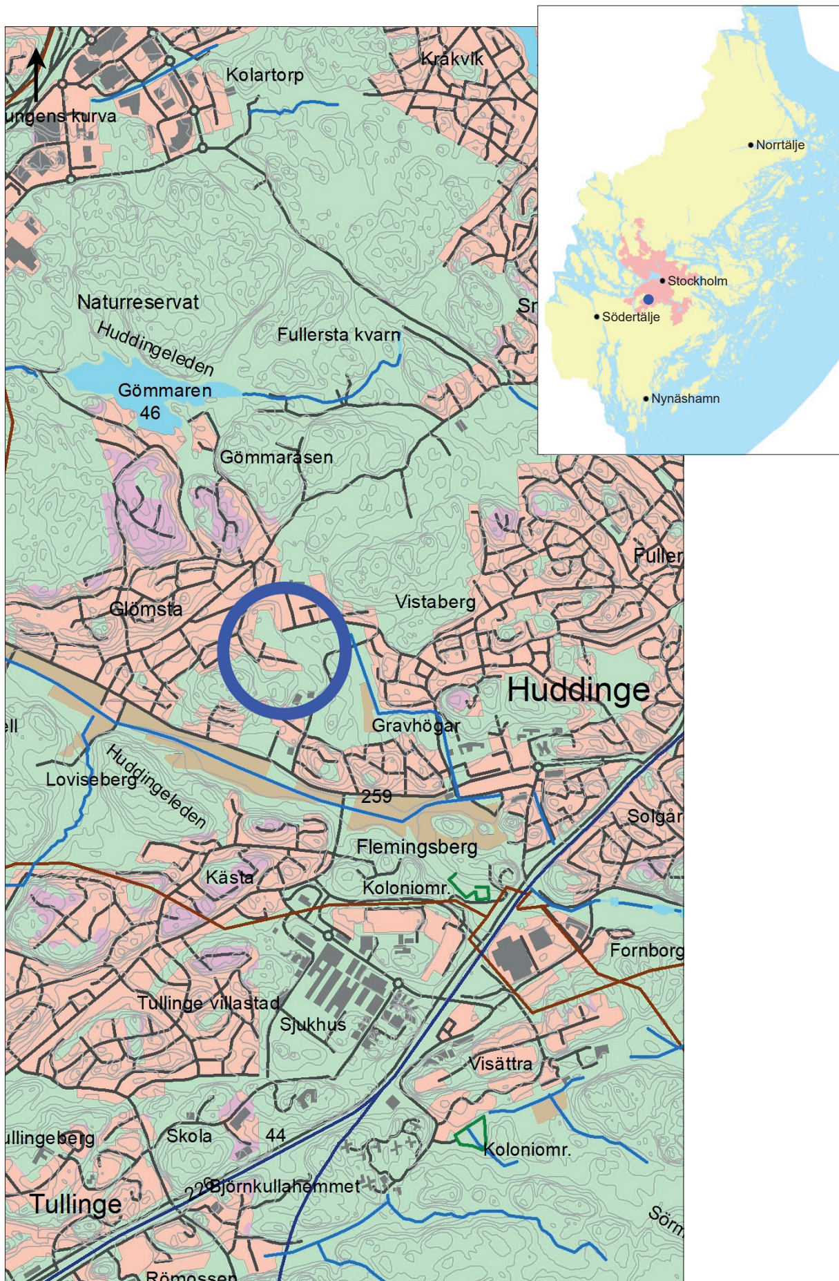
Figur 1. Utredningsområdet markerat med en blå ring. Utdrag ur Terrängkartan. Skala 1:50 000.