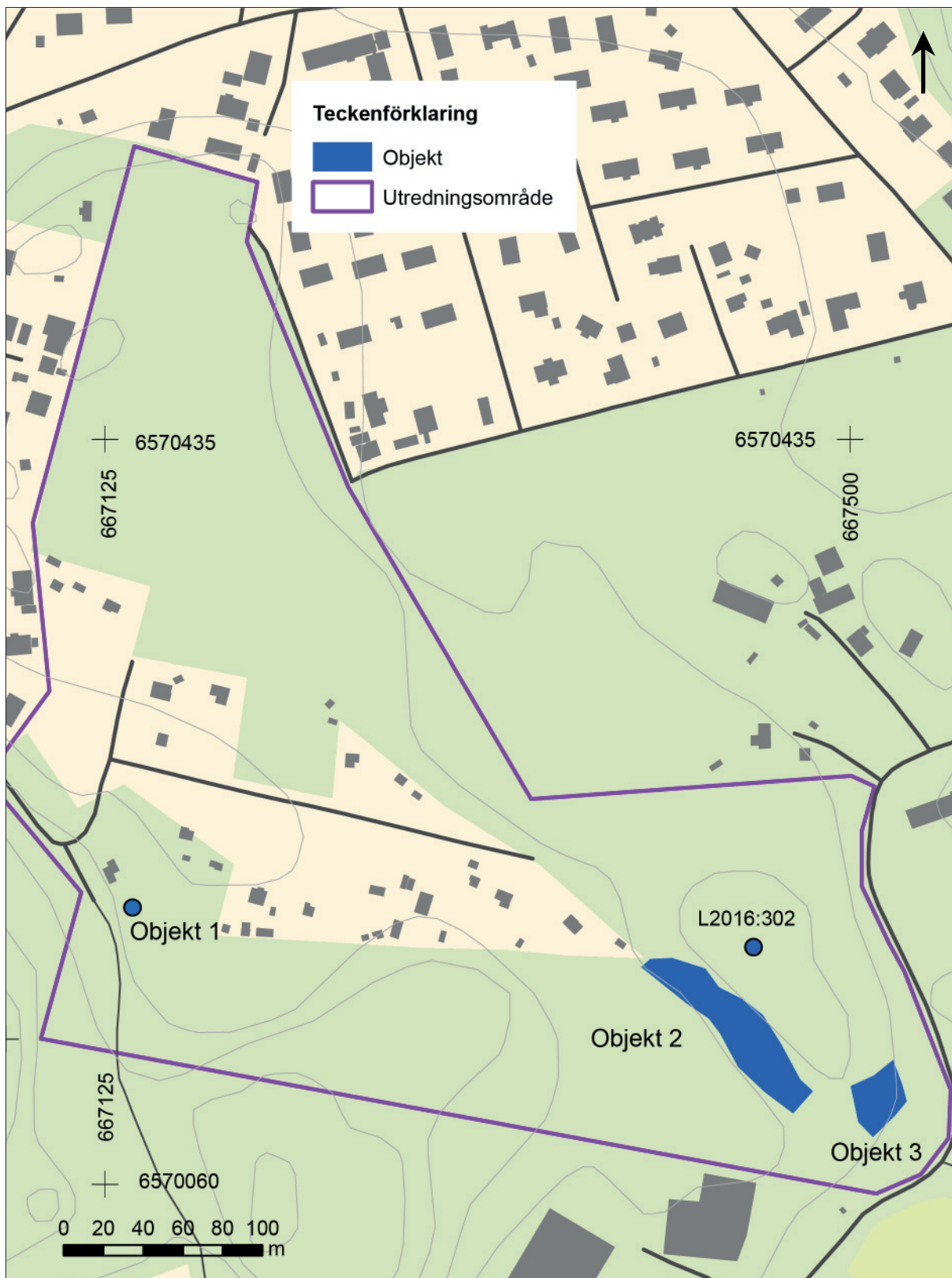
Figur 5. Objekt påträffade vid fältinventeringen. Utdrag ur Fastighetskartan. Skala 1:3 000.