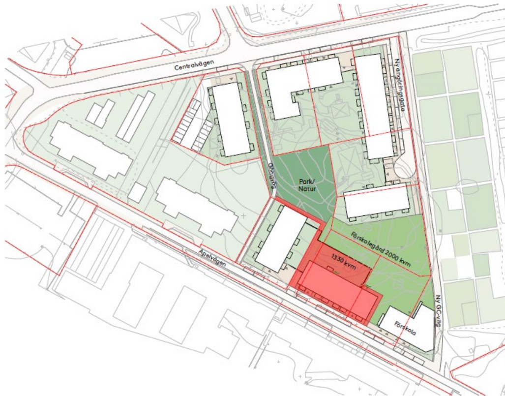
Illustrationsplan, föreslagen bebyggelsestruktur. ÅWL, JM