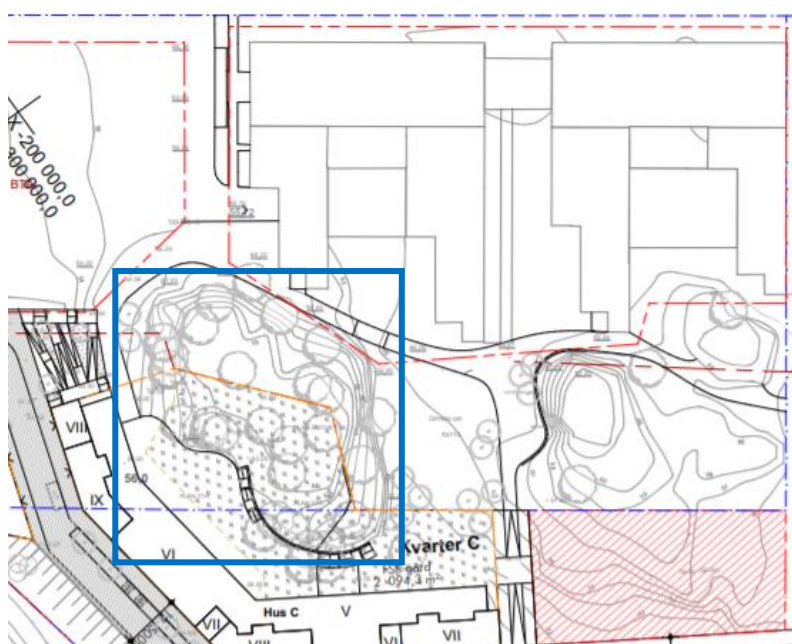
Figur 2 Situationsplan med synligt berg inom aktuella områden förstorat. Område med synligt berg som kunnat undersökas redovisat med blått. Ritning upprättad av Tovatt Architects & Planners AB

Inom de aktuella kvarteren kunde endast synligt berg identifieras inom kvarter C, se Figur 2 .