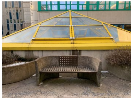
Karaktäristiska kulörer och fasadpartier på befintlig byggnad Novum.

Inom planområdet längs med Alfreds Nobels Allé finns en lindallé som klassats som biotopskyddad. Den berörda allén består av 16 vuxna parklindor som växer i en rad och därmed uppfyller de definitionen av en allé. Parallellt med de berörda träden växer ytterligare två rader med lindor, dessa berörs dock inte, då de ligger utanför planområdet. Med anledning av planerad bebyggelse har en ansökan om dispens från biotopskyddsbestämmelserna i 7 kap. 11 § miljöbalken (1998:808) för avverkning av allén lämnats in till Länsstyrelsen. Länsstyrelsen gav besked 21 januari 2022 om att bevilja dispensansökan förutsatt villkor uppfylls. Villkoren rör bland annat att för varje avverkat träd ett nytt lövträd planteras i en ny allé längs med Hälsovägen. Dispensansökan har gått ut. Innan detaljplanen går upp för antagande behöver byggaktören få en ny dispensansökan beviljad av Länsstyrelsen för att säkerställa planens genomförande.