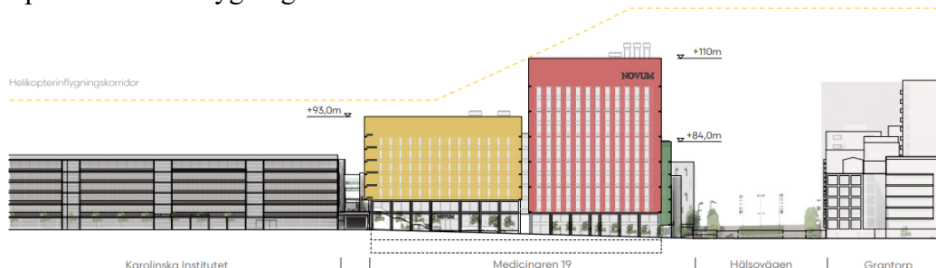
Elevation längs Alfred Nobels Allé. Förslaget knyter an till den lägre tandläkarhögskolan i söder och högre bostadsbebyggelsen norr om Hälsovägen. Föreslagna byggnader håller sig utanför inflygningskorridoren för helikopter. (Illustration av Tengbom)

Planområdet ligger delvis inom den östra helikopterinflygningskorridoren till Karolinska sjukhuset Huddinge. De tillkommande volymernas höjder har anpassats efter inflygningskorridoren.