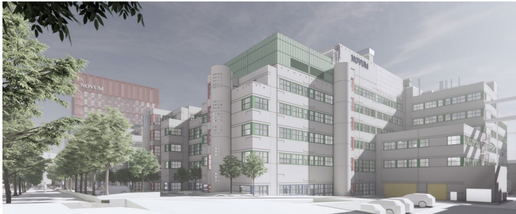
Koncept för tillbyggnad av fläktrum på befintliga Novum. Tillbyggnader på fläktrum görs i en kulör som bygger på befintlig byggnads gröna fönsterkulör. (Illustration Tengbom)

Mittskeppet var ursprungligen tänkt som en mötesplats där forskare, kliniker och företagare kunde äta lunch och utbyta tankar och idéer. Det skulle avvika gestaltningsmässigt och kännas som en öppning mellan laboratorieblocken. Idag saknas möjligheten att röra sig mellan alla våningsplan. En hänsynsfull komplettering föreslås för Mittskeppet för att möjliggöra en ny hiss och trapphus samt förbindelsegång. Kompletteringen placeras i mitten av volymen, så att den inte syns från Blickagången eller Hälsovägen.