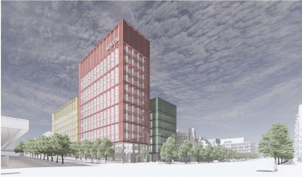
De planerade volymerna i relation till befintlig bebyggelse och omkringliggande gaturum. (Illustration av Tengbom)

Tillkommande volymer föreslås få en veckad fasad som riktar solavskärmande delar mot solens bana och lämnar heltransparenta glaspartier i riktningar där solen inte ligger på direkt. Den veckade fasaden bidrar till ett djup och mönsterverkan som känns igen från såväl Huddinge sjukhus reliefgjutna betongelement som från byggnaderna nordväst om planområdet, Technology and Health (TAH) & NEO, motsvarande vridna aluminiumraster. Det utanpåliggande rastret/solavskärmningen ger en flexibilitet i användandet av volymen samtidigt som den bidrar till ett sammanhållet gestaltungsuttryck. Fasaden bakom kan bli mer öppen eller sluten beroende på vilken verksamhet som flyttar in och vilka krav de har.