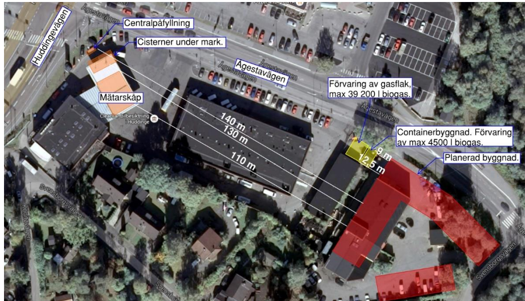
Figur 3. Den planerade byggnadens placering i relation till intilliggande tankstation och gaslager.

År 2019 erhöles ett permanent bygglov för förvaring av fordonsgasen. Ytan som förvaringen sker på ska nu inkorporeras i den nya detaljplanen. Därmed utvärderas riskerna med gasförvaringen på nytt i detta PM. I Figur 3 nedan framgår placeringen av gasflak samt kompressor- och högtrycksgaslager (containerbyggnaden).