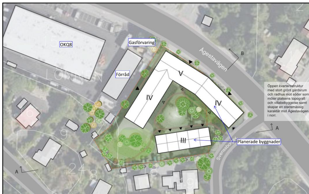
Figur 2. Gestaltning av aktuellt bebyggelseförslag för Lönnen 5.

I dagsläget finns det en industribyggnad på fastigheten Lönnen 5, men planen är att i stället uppföra flerbostadshus där. Detaljutformningen av byggnaderna är inte fastställd men byggnaderna kommer att bestå av tre sammanbyggda huskroppar som kommer att vara mellan 4–5 våningar samt en friliggande radhuslänga i tre våningar. Byggnaderna förväntas inrymma ca 70 bostadslägenheter. Se Figur 2 för utformning av de planerade byggnaderna.