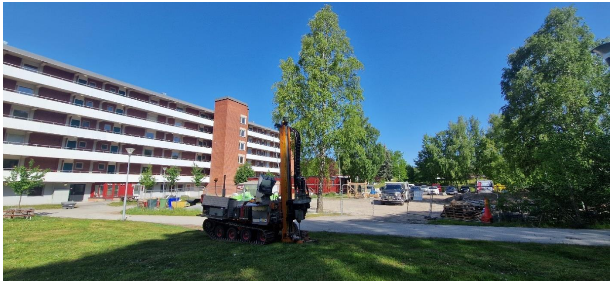
Borravn utför viktsöndering i undersökningspunkt 25CW11.