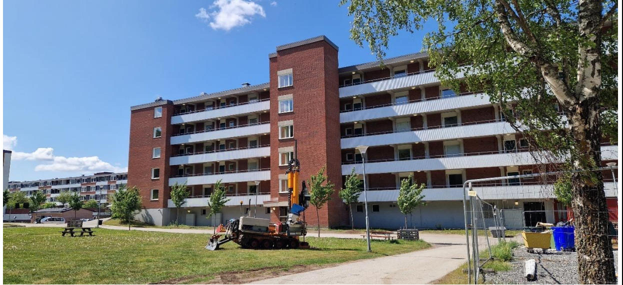
Borrvagn utför jordbergsondering i undersökningspunkt 25CW10

Geoteknisk borrvagns typ, id, förare och senaste kalibreringsdatum: Geotech 604DD 18559 (ROHN) 2024-07-05