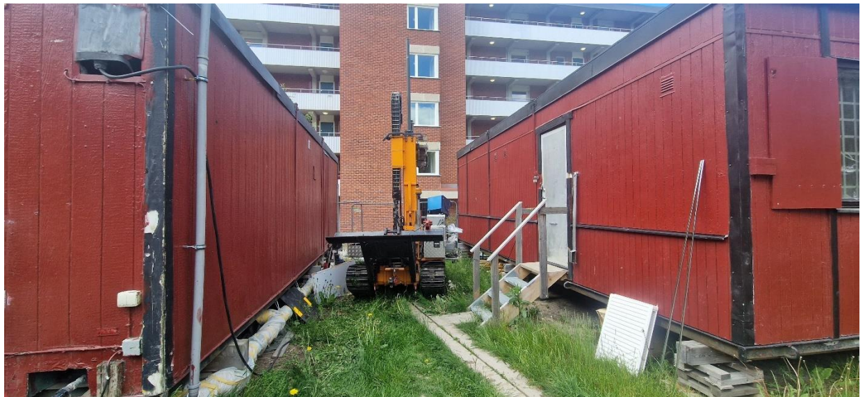
Borravn utför miljöprovtagning i undersökningspunkt 25CW04