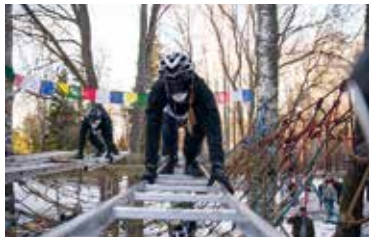
Ibland behövdes stegar för att ta sig över "glaciärsprickorna".

Snart dags att planera nästa lopp i Flottsbro