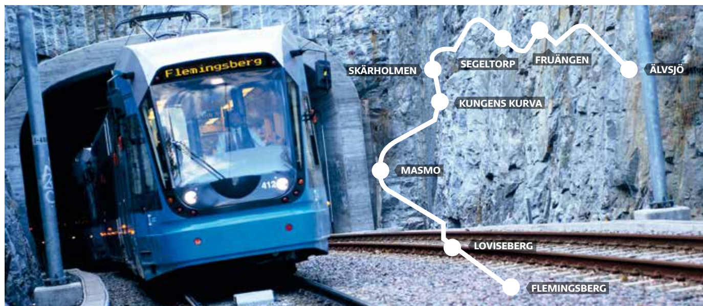
Nu är det bestämt: Spårväg syd ska byggas. Bilden är ett fotomontage.

Sverigeförhandlingen tar på regeringens uppdrag fram förslag till nationellt viktiga infrastrukturprojekt som kan ge 100 000 nya bostäder fram till 2035, men också en bättre arbetsmarknad och ett hållbart resande.