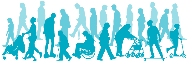
ILLUSTRATION LINNEA PÅHLMAN