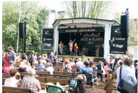
Bröderna Lindgren och Friheten spexade från scenen.

något för alla: loppis, matställen och en idrottskubb med massor av skojiga prova-på-aktiviteter för barn, exempelvis klättervägg, bågskytte, "alien bikes", judo och orientering.