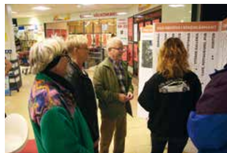
När dialogen flyttade in i Flemingsbergs centrum i höstas fick de som ville ”plugga” önskemål på en vikkvägg.