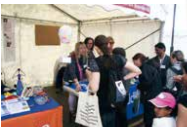
Representanter från boendestöd berättade mer om sin verksamhet.