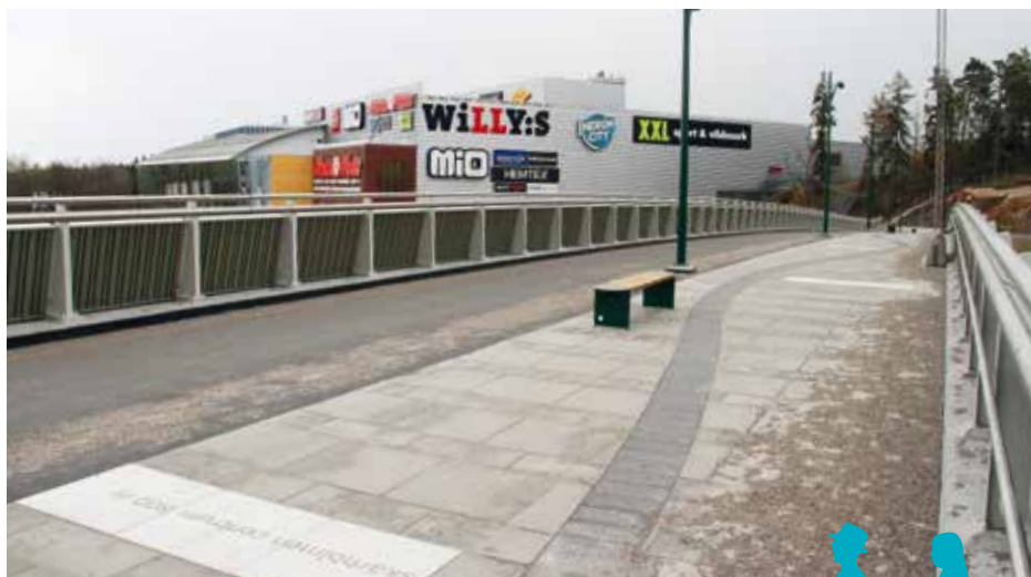
Sadelmakarbron vid Heron City är invigd.