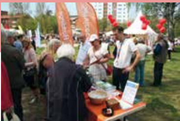
Huddinge kommuns servicecenter fanns också på plats i Södalsparken.