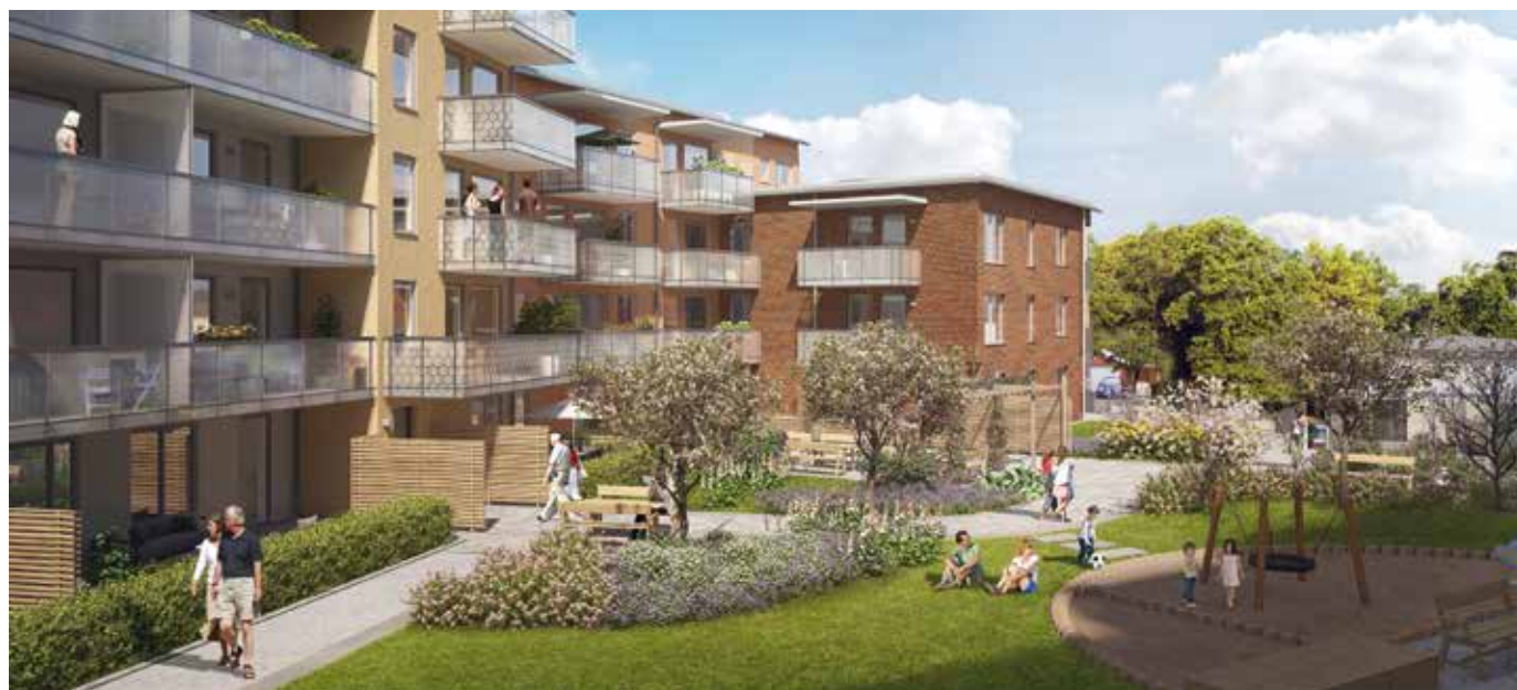
Om cirka tre år ska det nya kvarteret i Stuvsta centrum stå klart.