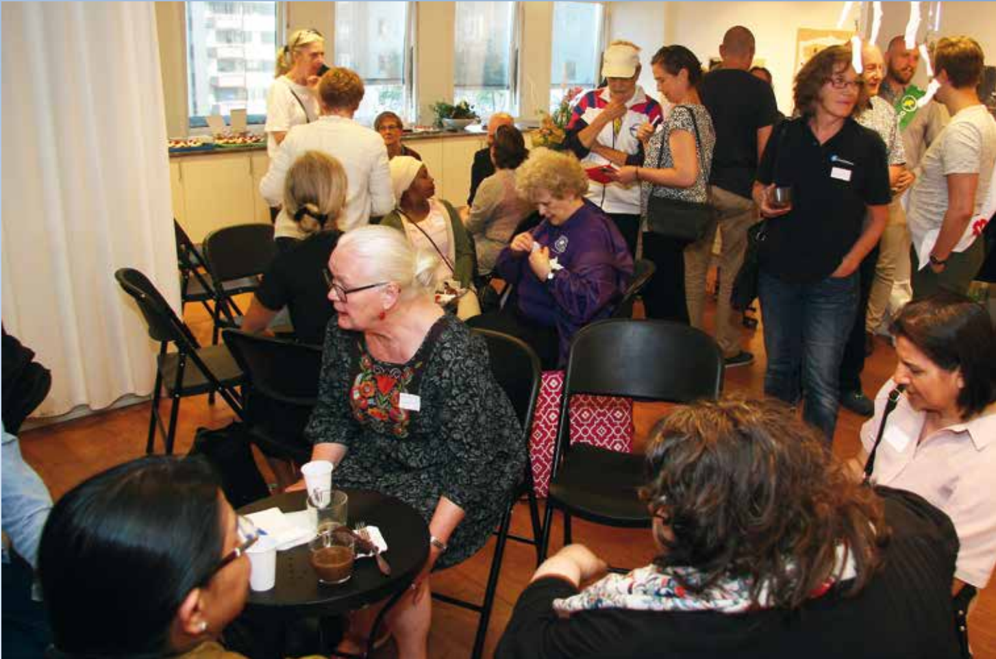
Valdialogen i Skogås blev en succé. Drygt 40 personer mötte upp.