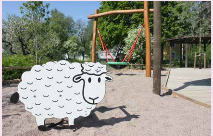
Parken vid Vallmyravägen.