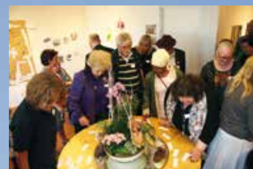
Ett bord var belamrat med små samtalslappar med ord.