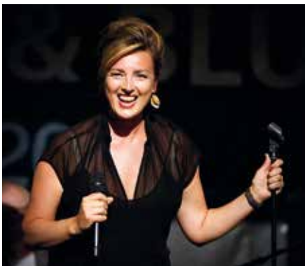
Sinne Eeg turnerar världen runt och gjorde ett stopp i Huddinge i slutet av maj.

Sinne Eeg, en av de ledande jazzvokalisterna i Europa, och ett pärlband andra skickliga och populära artister lockade över 2 000 besökare till årets Huddinge jazz och blues i Sjödalsparken.