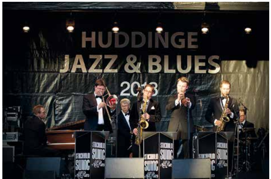
Stockholm Swing All Stars svängde till det ordentligt.

Huddinge jazz och blues arrangeras varje år i slutet av maj och årets festival var den tjugosjunde i ordningen. Festivalen varar i två dagar och publiken kunde i år njuta av såväl strålande väder som några av våra