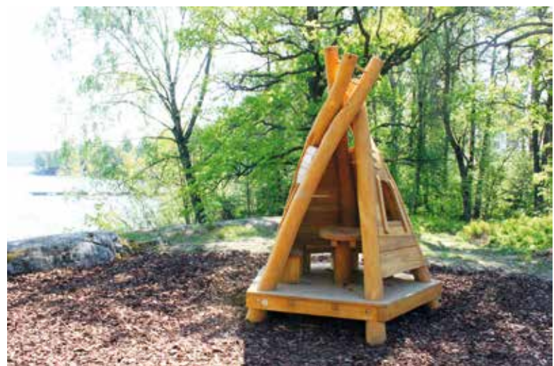
En ny koja i Sjöängsparken.

Länna har parken vid Vallmyravägen fått gunga, hängmatta, karusell, rutschkana, koja och en gräsplan i mitten för bollek.