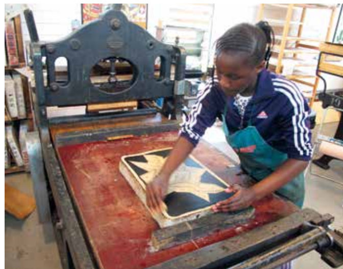
13–17/8 anordnas dagläger på Litografiska Museet.

WELCOME 2 SUMMER , Visättra Sportcenter kl. 12–18, Kvarnängsvägen 12, Huddinge. Fotboll, basket, dans, måleri samt avslutning med grill och musik. Ålder: 6–17 år. Arrangör: Second Chance.