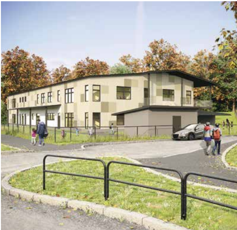
Så här kan den nya förskolan vid Sjötorpsparken komma att se ut.