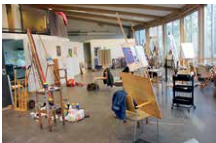
32 av skolans elever studerar måleri med fokus på att utvecklas i sitt skapande.