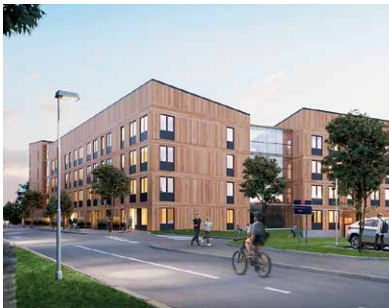
Visionsbild för bland annat Sändaren 2 i Trångsund.