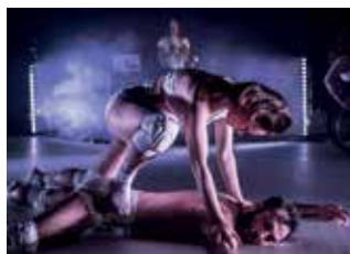
Skirtpower i Tonsalen 20 mars.

Magasinet kl. 11, Juringe Gård, Mäster Lorentz väg 3, Segeltorp. Tant Klaver spelar klassikern ”Den fula ankungen” som letar förtvivlat efter vem han är och var han kommer ifrån. Han möter många ankor och hönor, en del är elaka andra lite snällare och till slut möter han sig själv. En rolig interaktiv föreställning med sång och musik. Biljetter delas ut en timme innan föreställning. Ingen föranmälan och först till kvarn gäller. Ålder: 2–8 år. Mer info: segeltorpkultur.se .