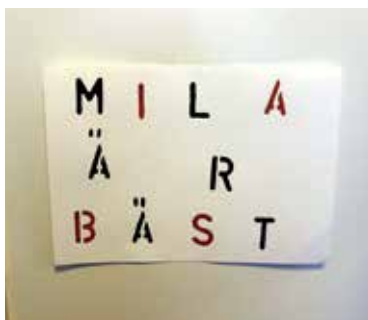
”Mila är bäst” står det på en lapp intill ingången.

– Mila fungerar som avväpnare och andrum för enskilda elever men också för flera elever samtidigt. Det är helt prestigelöst. Några kramar om henne en stund. Man