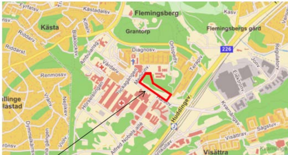
Detaljplaneområde, se m arkering

Planförslaget medger uppförande om totalt cirka 800 nya bostäder vilket ger en tät och sammanhållen bebyggelse mellan Flemingsbergs centrum och järnvägsstationen. Planen är förenligt med en hållbar utveckling med avseende på ett effektivt nyttjande av tätortens markresurser.