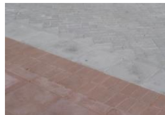
AVVIKANDE MATERIAL/FÄRG Exempelbilder Hela gc-vägen utgörs av material eller färg som upplevs anpassat för och uppmärksammar till gångfart.