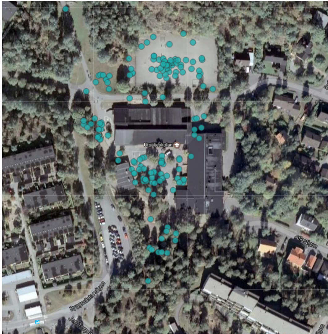
De blå prickarna visar platser på skolgården där ni brukar vara.