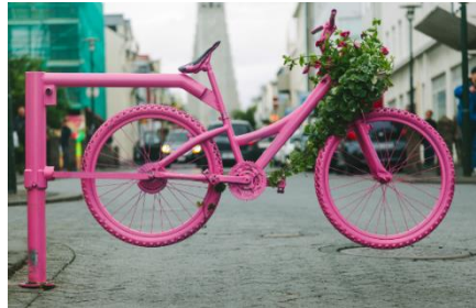
CYKELGRIND/CYKELBOM Exempelbilder Placeras "innan och efter" skolgård, alt. kan utföras på flera plaster längs sträckan.