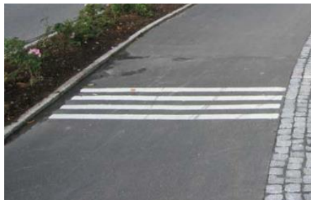
MÅLNINGAR i MARK Exempelbild "Rumble strips" Placeras på flera platser längs gc- vägen.