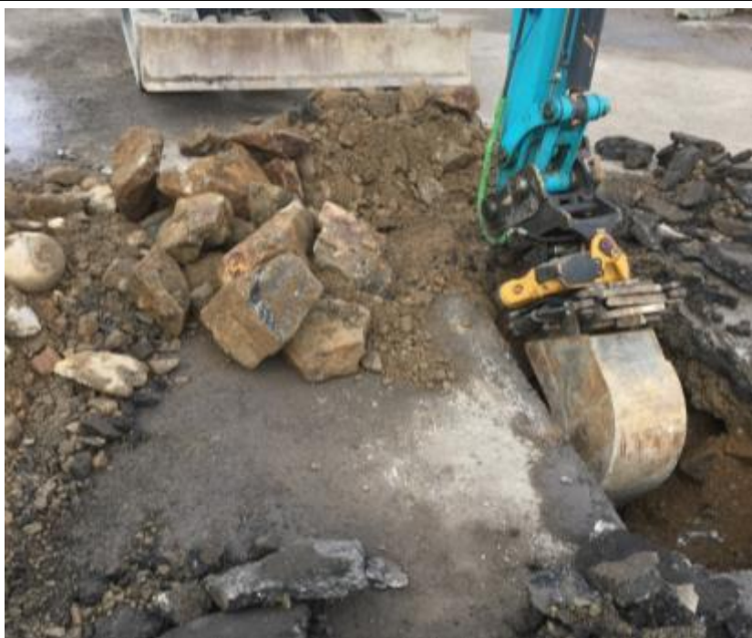
Figur 3. Schaktning av massor inför provtagning av underliggande material. Bilden visar markens sammansättning av sand, grus och block.