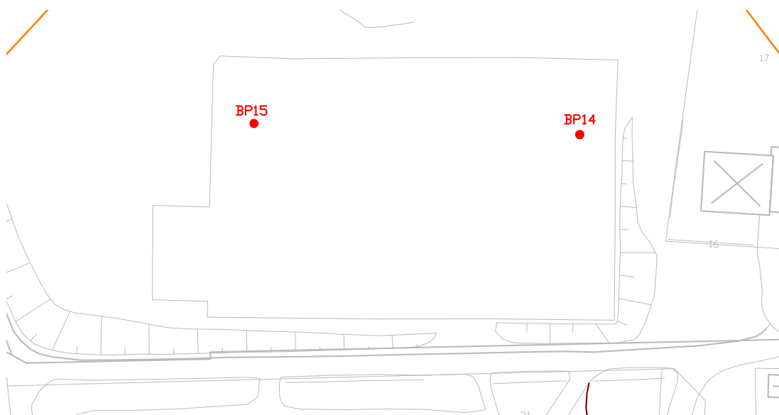
Figur 6. Provpunkternas läge i område B, fotbollsplanen. Norr är uppåt i bilden. Källa; utdrag ut baskarta modifierad av Geoveta 2017-04-10.