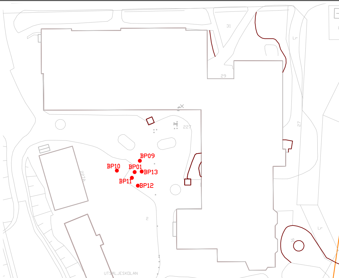
Figur 5. Provtagningspunkternas läge i område A, skolgården. Norr är uppåt i bilden.