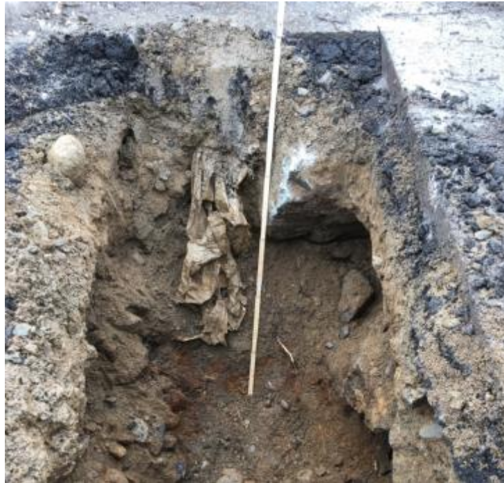
Figur 4. Visar provgropen BP10 där det provtagna materialet bestod av fyllnadsmassor och i det djupaste provet ett tunt lerlager. Schaktväggen innehöll även plastrester.

Uppdragsnummer 230 543 Uppdragsnamn Huge Utsäljeskolan