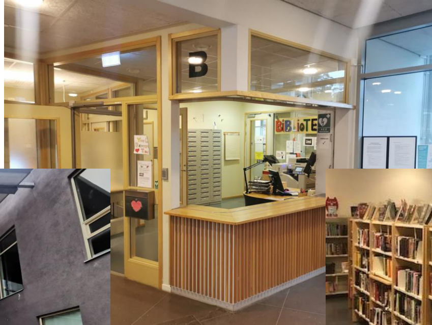
Reception och bibliotek