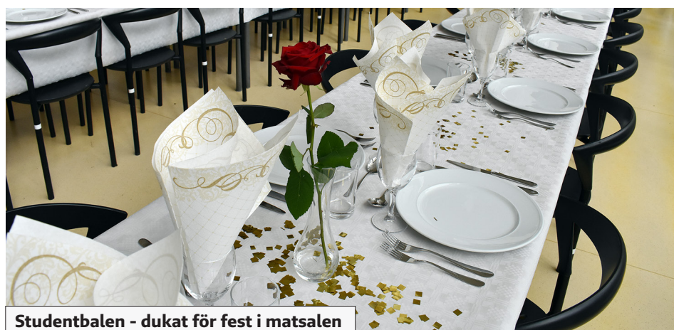
Studentbalen - dukat för fest i matsalen

Gott som erbjuds är bland annat hemgjorda smörgåsar och fikabröd, kokt ägg, frukt, varma och kalla drycker och juicer. Eller varför inte prova keso med bär, en nyttig grönsaksdipp eller en bärsmoothie. Självklart finns både vegetariska och veganska alternativ. Plus att varje dag finns ett prisvärt "dagens erbjudande".