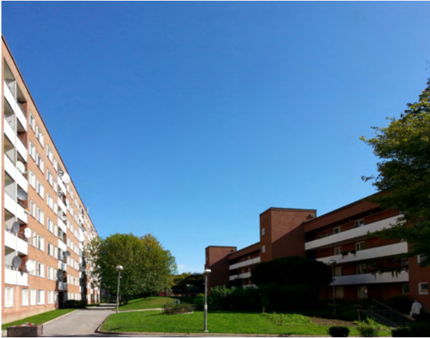
Värby Gård