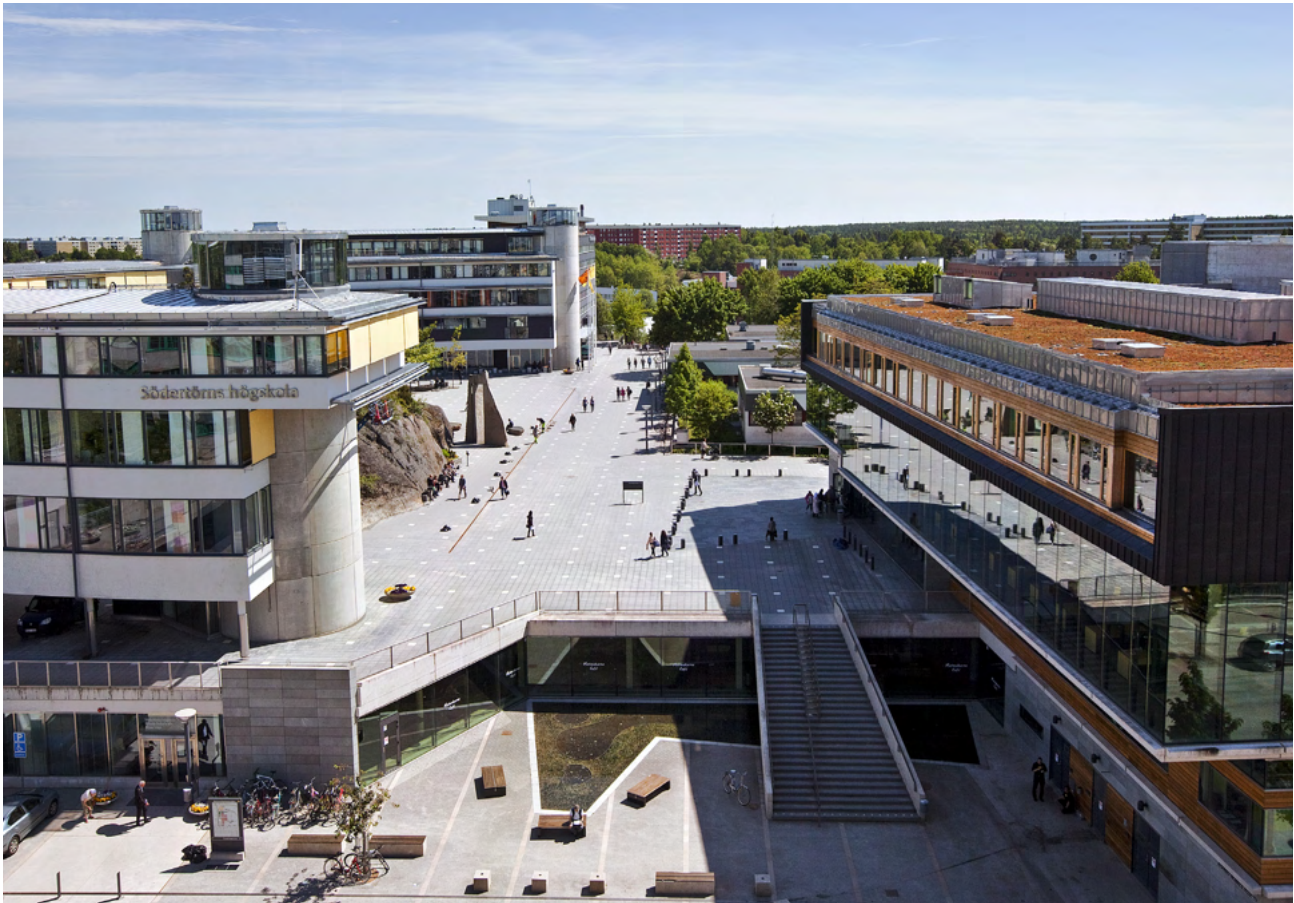
Södertörns Högskola