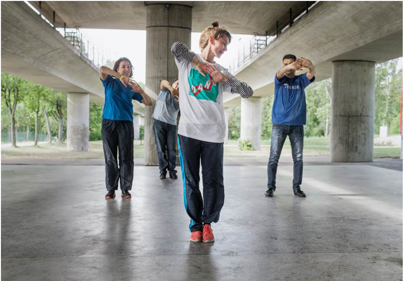
Vårby Gård