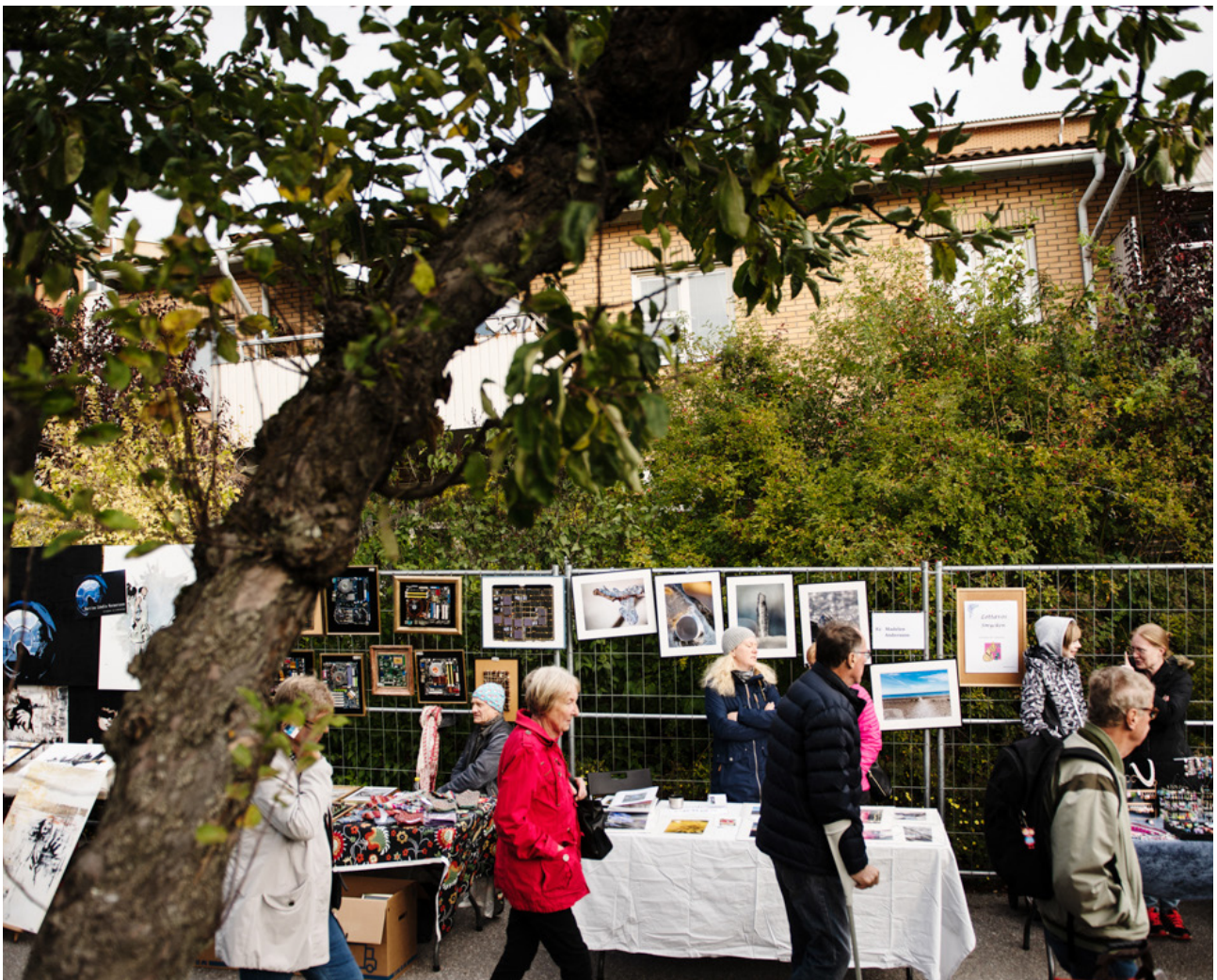
1000 meter konst

I det hållbara samhället, ur demokratiska, sociala och ekologiska aspekter, har kulturen en bärande roll. Stadsrummen bör innehålla konstupplevelser och inspirera till lek och kreativitet. Konst ger identitet och karaktär till platsen, är intresseväckande och kommunikativ. Konst i stadsrummet är också ett sätt att tillgängliggöra konsten för fler. Investeringar i konst bör uppmuntras i varje byggprojekt.