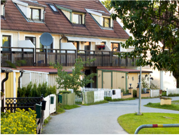
Skogås, (Bild: Thomas Henriksson)