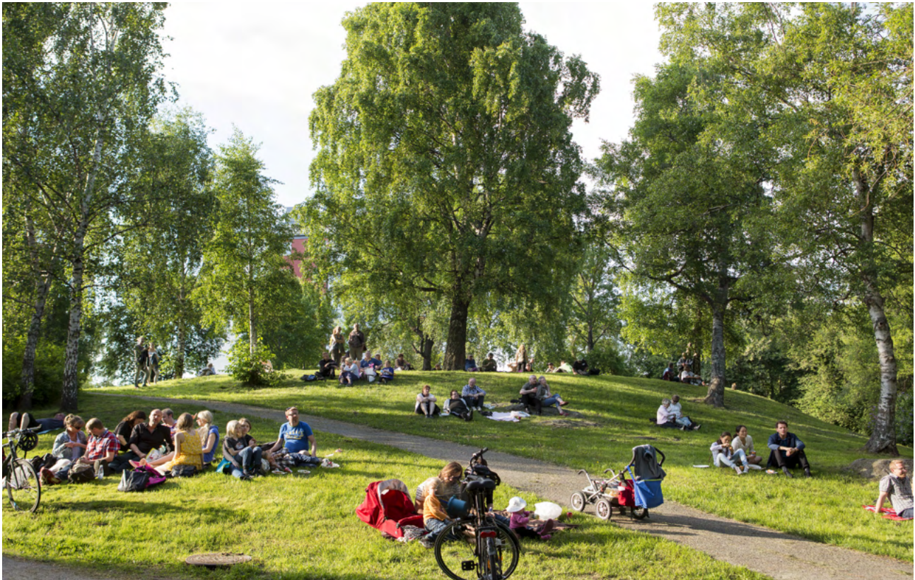
Södalsparken, (Bild: Mattias Malm)