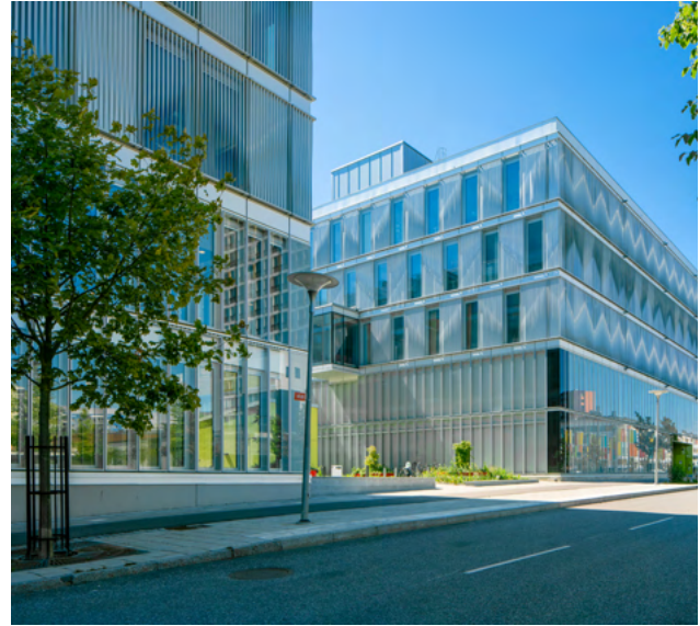
Technology and Helth, Flemingsberg