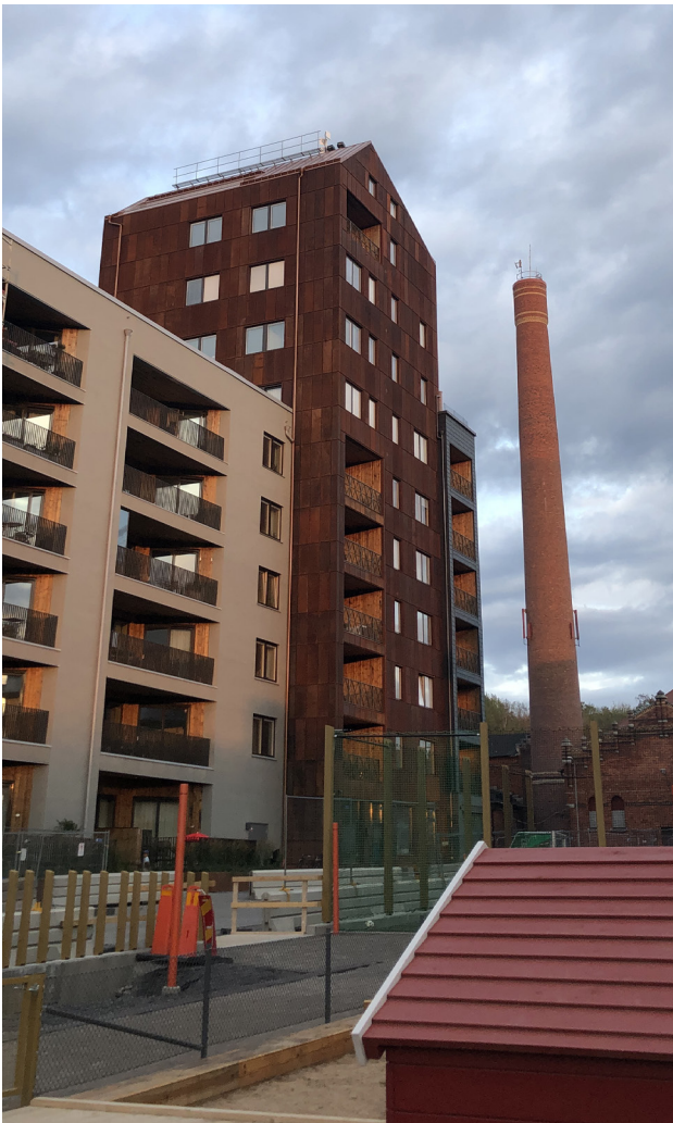
Norra Djurgårdsstaden

Prioritera stadsrummets användbarhet och kvalitet. När tätheten ökar blir det särskilt viktigt att planera gårdar och stadsrum optimalt. Dessa kommer att användas flitigt och många ska samsas om ytorna. Parker, torg och stadsgator planeras för att vara användbara för flera målgrupper och aktiviteter. Den kanske viktigaste kvaliteten i vårt klimat är att platser är solbelysta, vilket bestäms av väderstreck och byggnadshöjder. Stadsrummen bör också skyddas från buller.