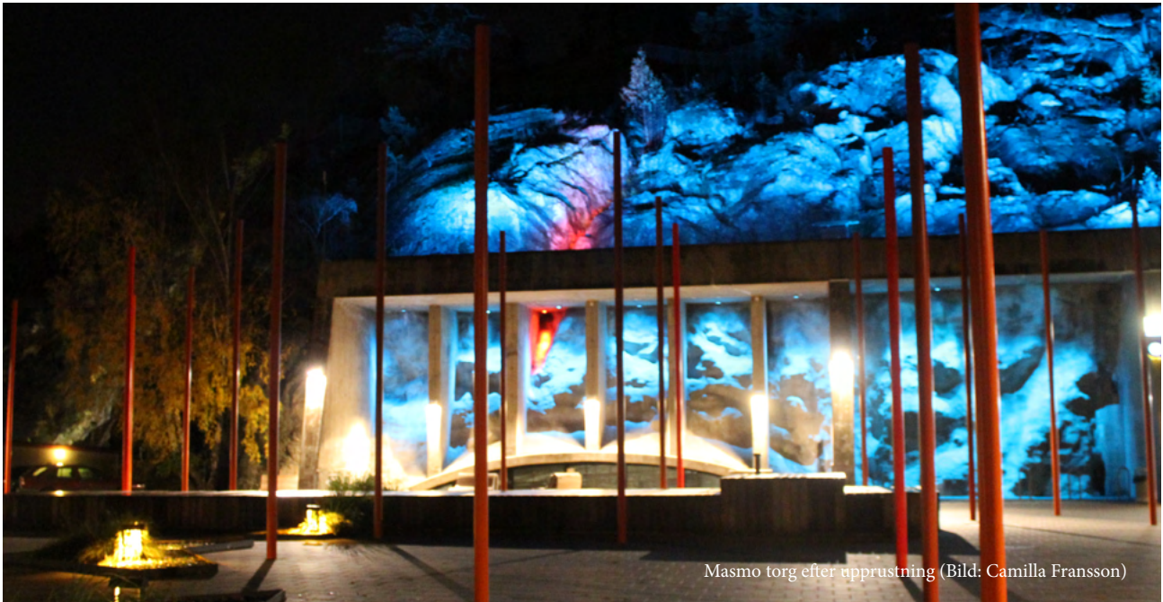
Masmo torg efter upprustning