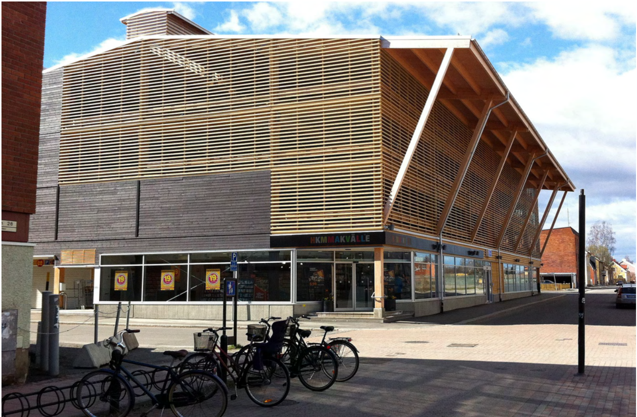
Parkeringshus i massiv- och limträ, Skellefteå av AIX Arkitekter