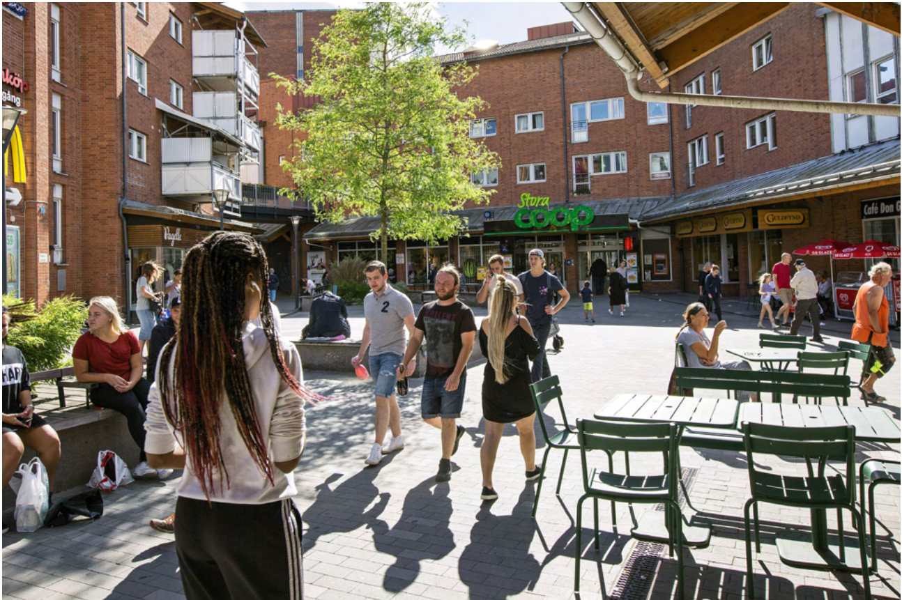
Huddinge centrum