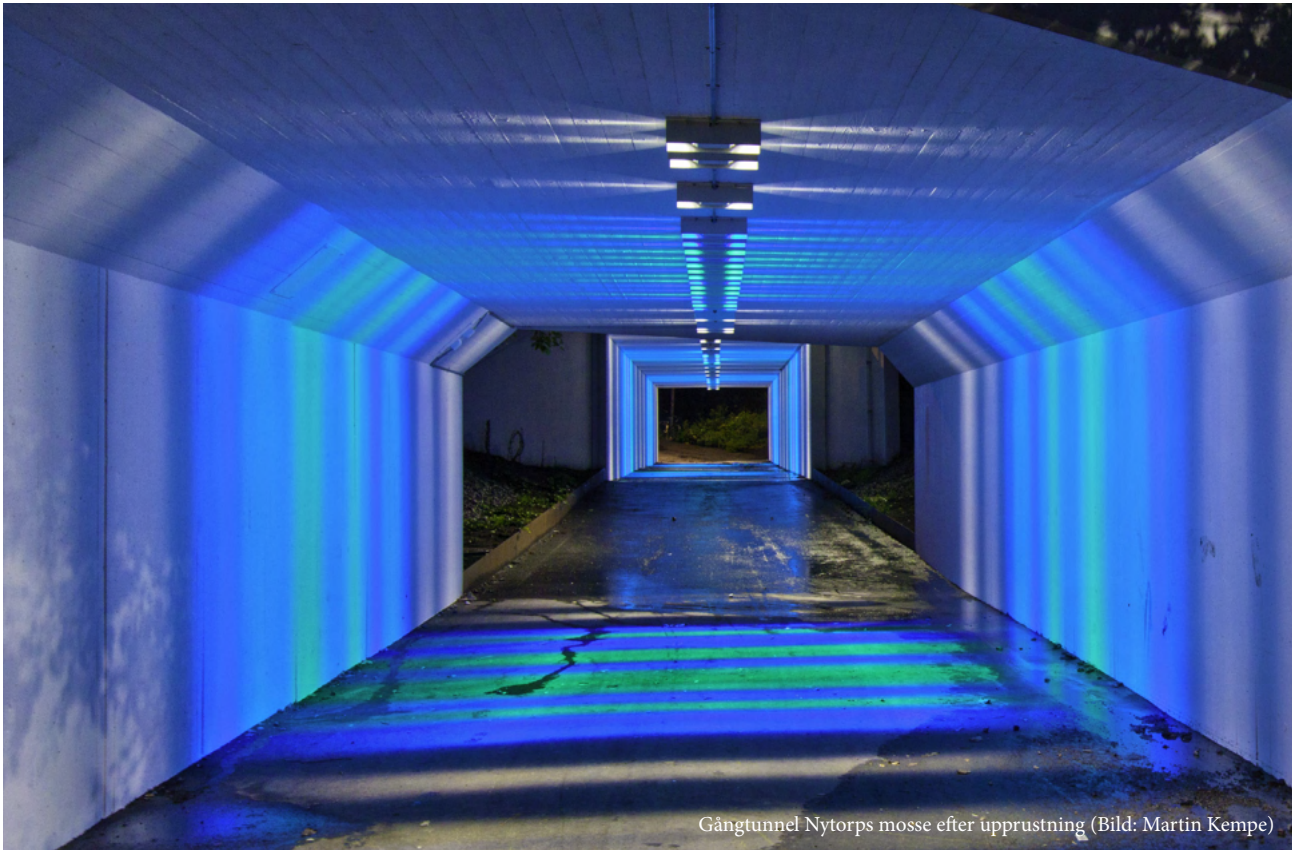
Gångtunnel Nytorps mosse efter upprustning