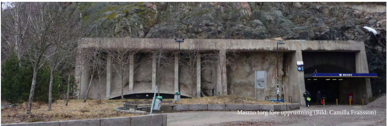
Masmo torg före upprustning