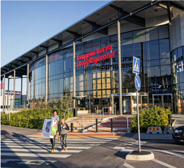
Kungens Kurva