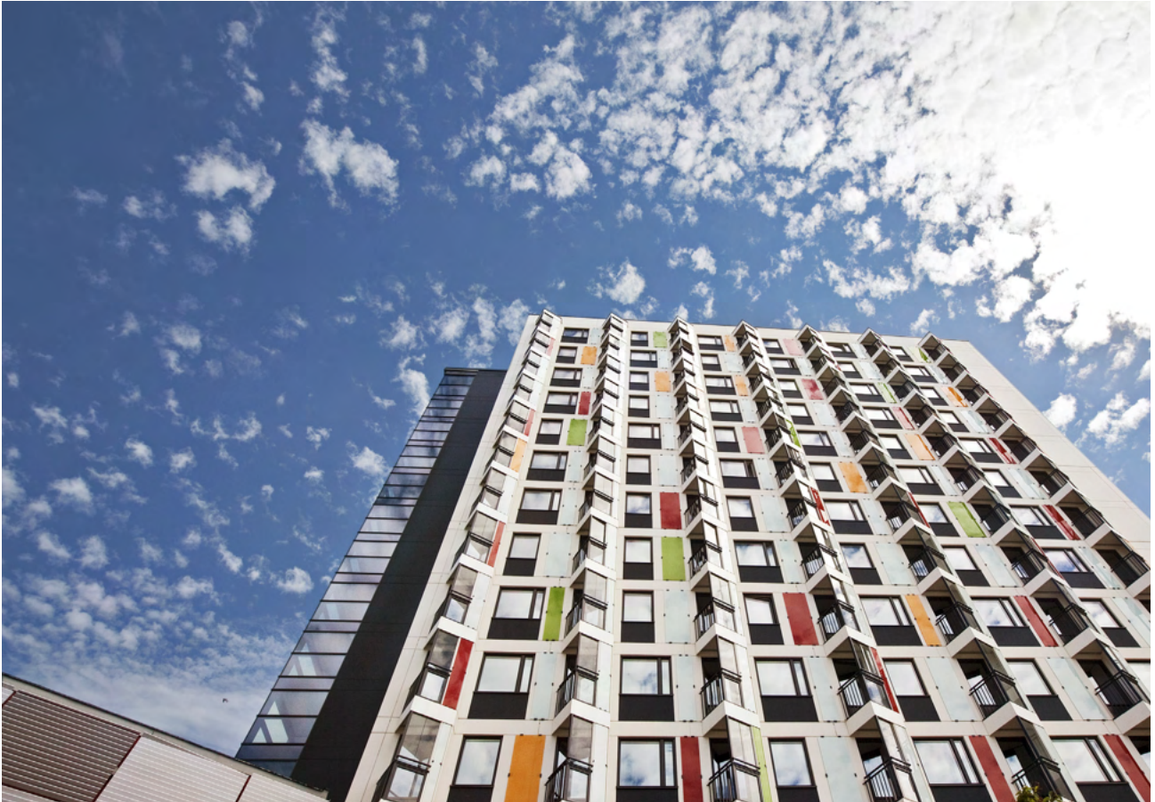
Studentskrapan i Flemingsberg