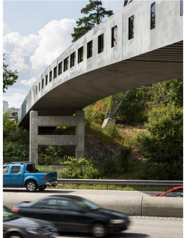
Gång- och cykelbro

Huvudgator inom bebyggelseområden har ibland ut-