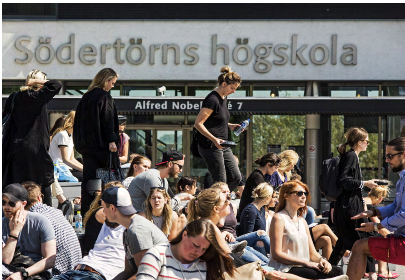
Södertörns Högskola