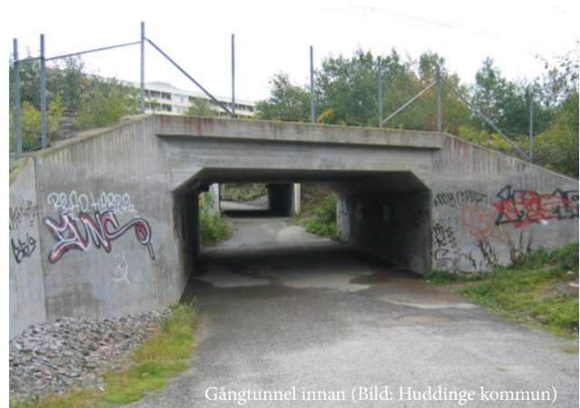
Gångtunnel innan

Ta hand om och rusta upp i befintliga områden. Klotter, nedskräpning och trasig belysning kan skapa en känsla av att platsen inte är omhändertagen. Vid komplettering i befintliga områden ska också befintliga fasader och utemiljöer tas om hand. Den befintliga och den nya bebyggelsen ska kännas som en helhet.