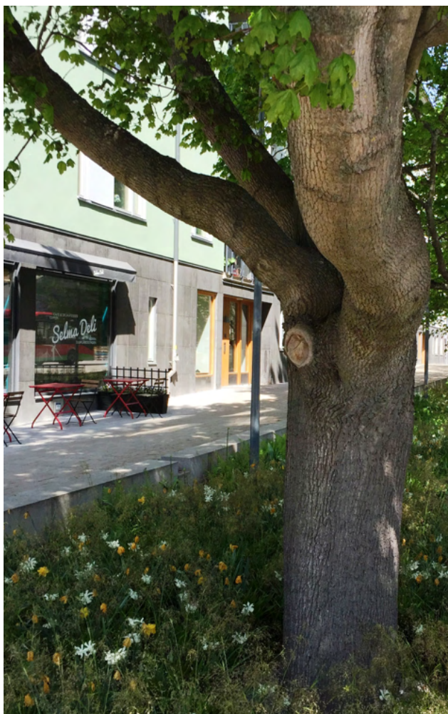
Norra Djurgårdstaden

I de mer tätbebyggda områdena är det viktigt att tillföra grönska och utnyttja alla de ytor som finns, samt höja kvaliteten på den befintliga grönskan. I nya större områden ska parker pekats ut. Stadsodling, bostadsgårdar, gröna stråk, blomprakt på torg och gator, gröna tak och fasader, öppna dagvattenlösningar och vattenlek är exempel på möjlig grönsstruktur. Vid utformning av grönytor ska barnperspektivet beaktas. Variation i vegetation och terräng ska stimulera till lek- och aktivitetsmiljöer för barn i alla åldrar.