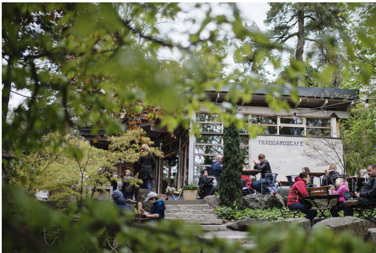
Zetas Trädgårdscafé