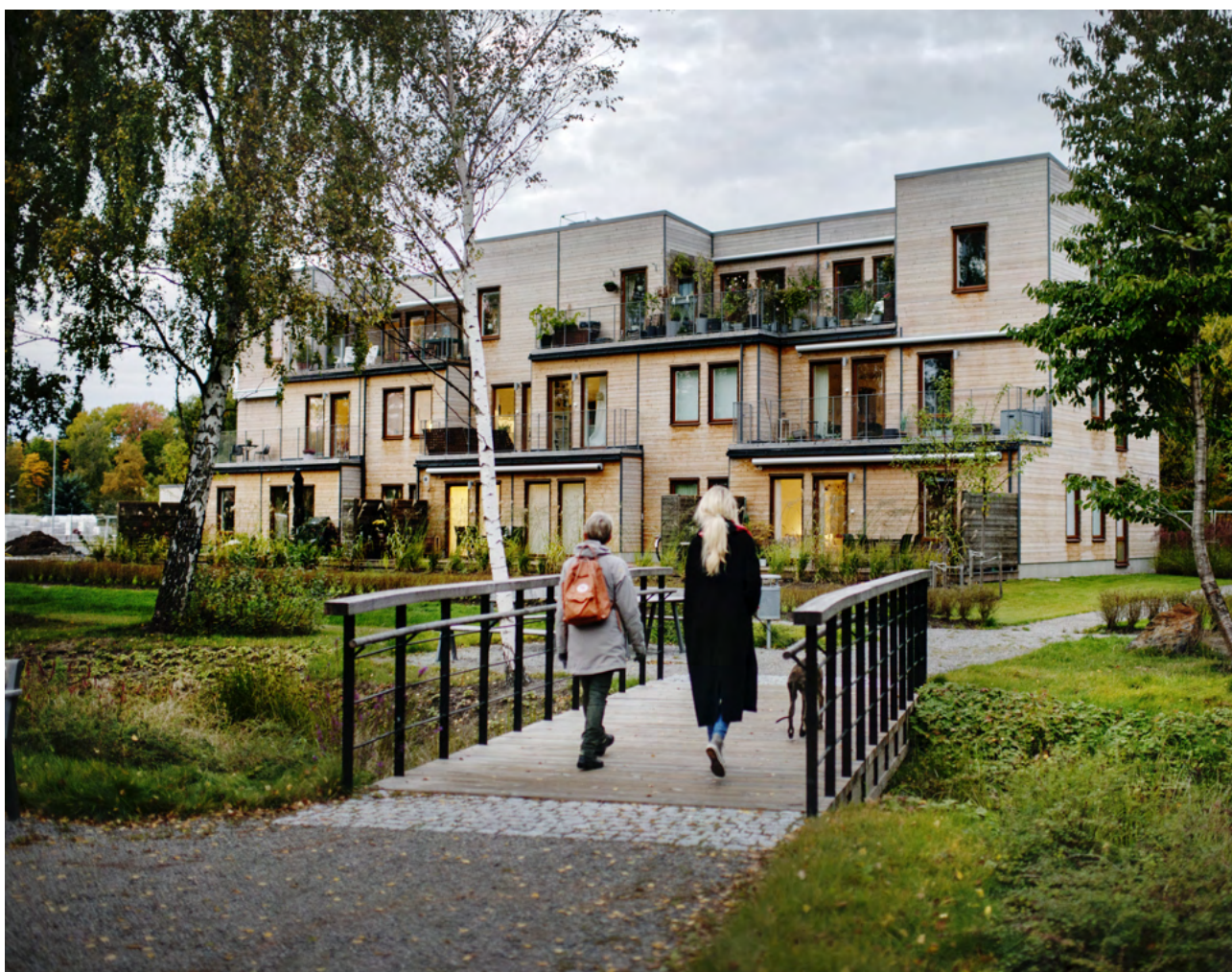
Ängsnäs glänta, (Bild: Maja Brand)

Arkitektur handlar inte enbart om hur ett hus ser ut, vilken fasad det har eller om det anses vara fult eller vackert. Arkitektur handlar om utformandet av vår fysiska miljö, om byggnaderna men också rummen mellan husen. Arkitekturen handlar om siluetter, siktlinjer, kulör och fasadmateriäl. Arkitektur handlar dock framförallt om vilken upplevelse och känsla man får i den bebyggda miljön. Arkitekturstrategin ska kunna ge svar på vad det är som egentligen spelar roll samt resonera om vad som genererar arkitektonisk kvalitet. Till stor del handlar det om god planering och framförhållning.