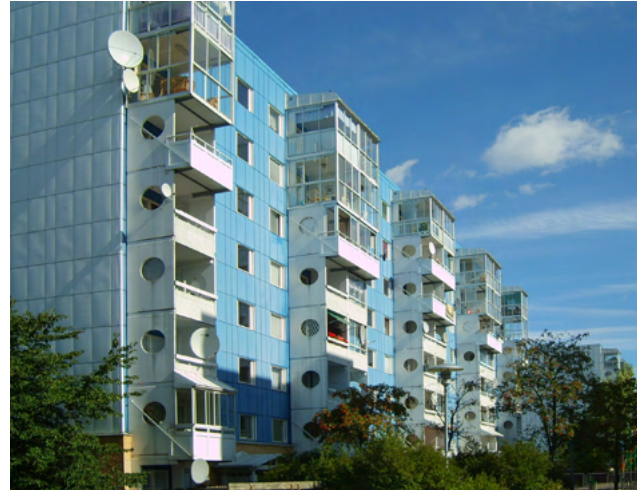
Grantorp i Flemingsberg