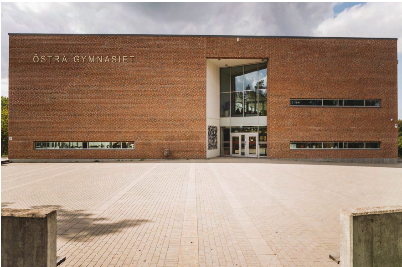
Östra gymnasiet

Byggnader som närboende och andra har koppling och tillgång till skapar gemensamma värden samt stolthet.