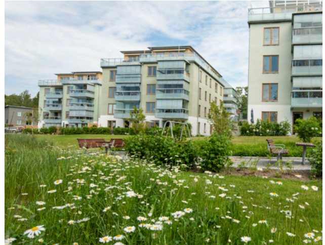
Kvarteret Gulsparven

Puts och tegel är vanligast som fasadmateriäl. Trä- och smidesdetaljer är vanligt och ibland förekommer plåt i balkongräcken och tak.