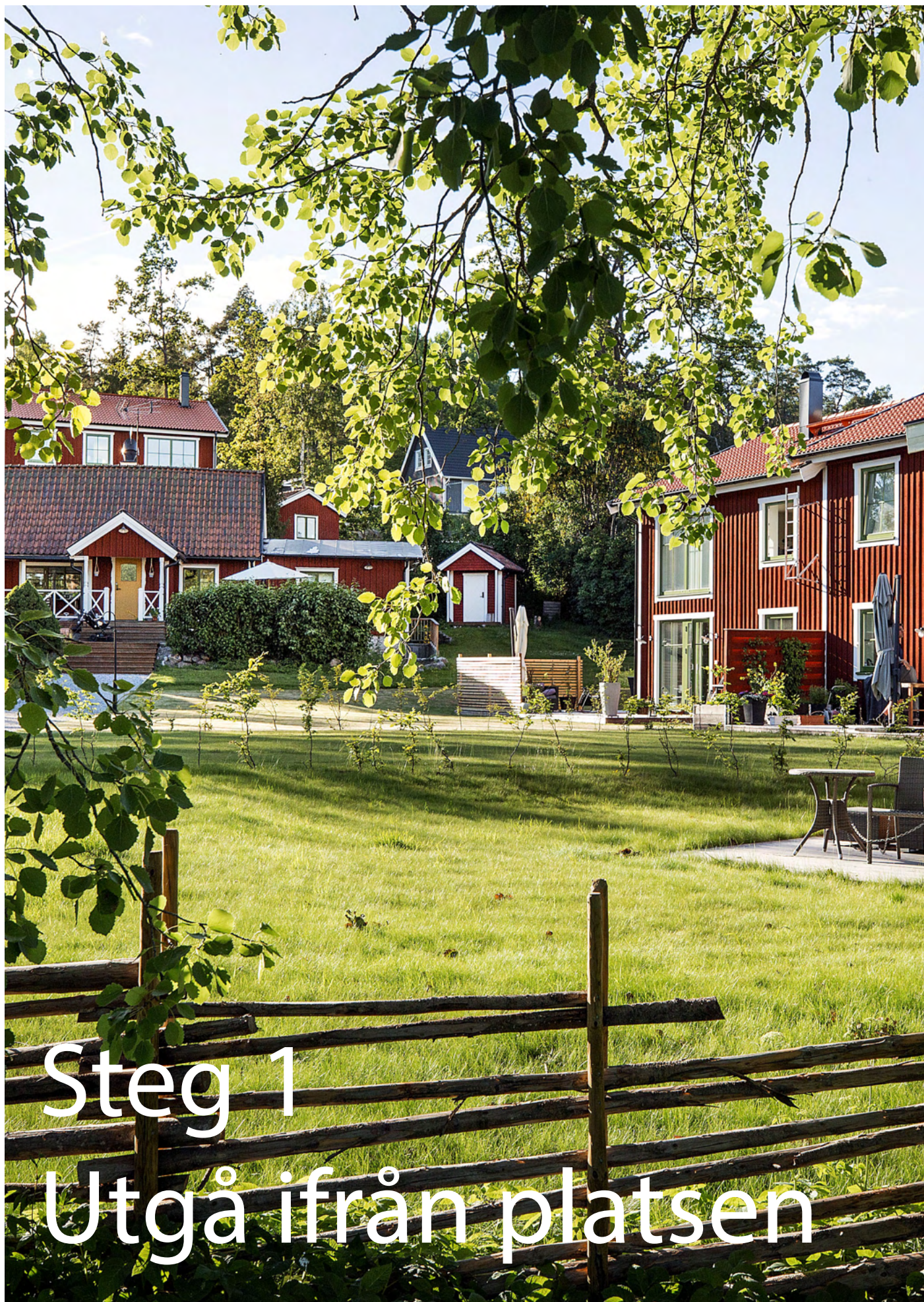
Gretas Backe