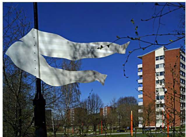
Konstverk och vägvisare till Tvätterimuseet

Begreppet kulturmiljö omfattar hela den av människan påverkade fysiska miljön. Kulturvärden kan i varierande grad tillskrivas enskilda byggnader, anläggningar och lämningar såväl som hela miljöer och stora landskapsavsnitt. Det är inte alltid som bevarande av kulturhistoriskt värdefulla platser och byggnader går hand i hand med den tänkta utvecklingen av ett område. Bevarande vägs till exempel mot behov av fler bostäder, bättre service, förbättrade sociala möjligheter eller en modernisering av verksamheter. Vid stadsutveckling är det viktigt att försöka se kulturmiljön som en resurs till det nya området och inte som ett hinder.