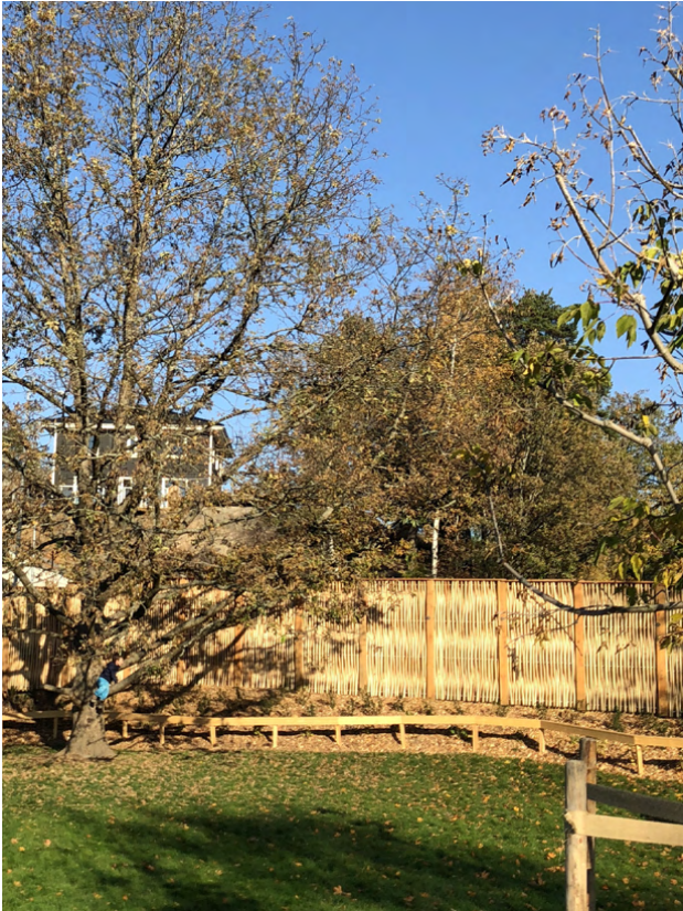
Bullerplank Ängsnäs